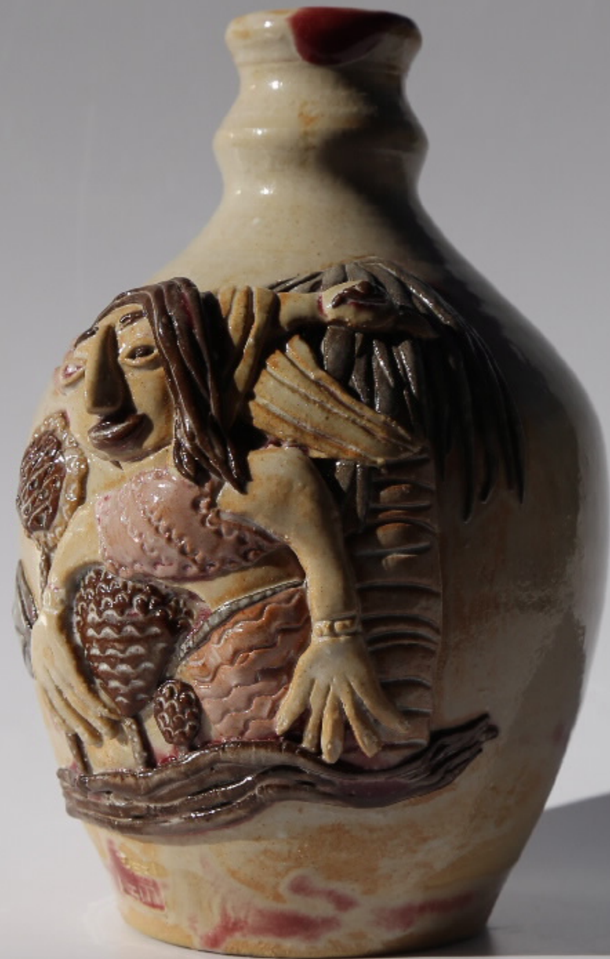
七水集图(局部)号 尺寸: 9.5cm x 2.5cm x 13.5cm 作者: 张汉东