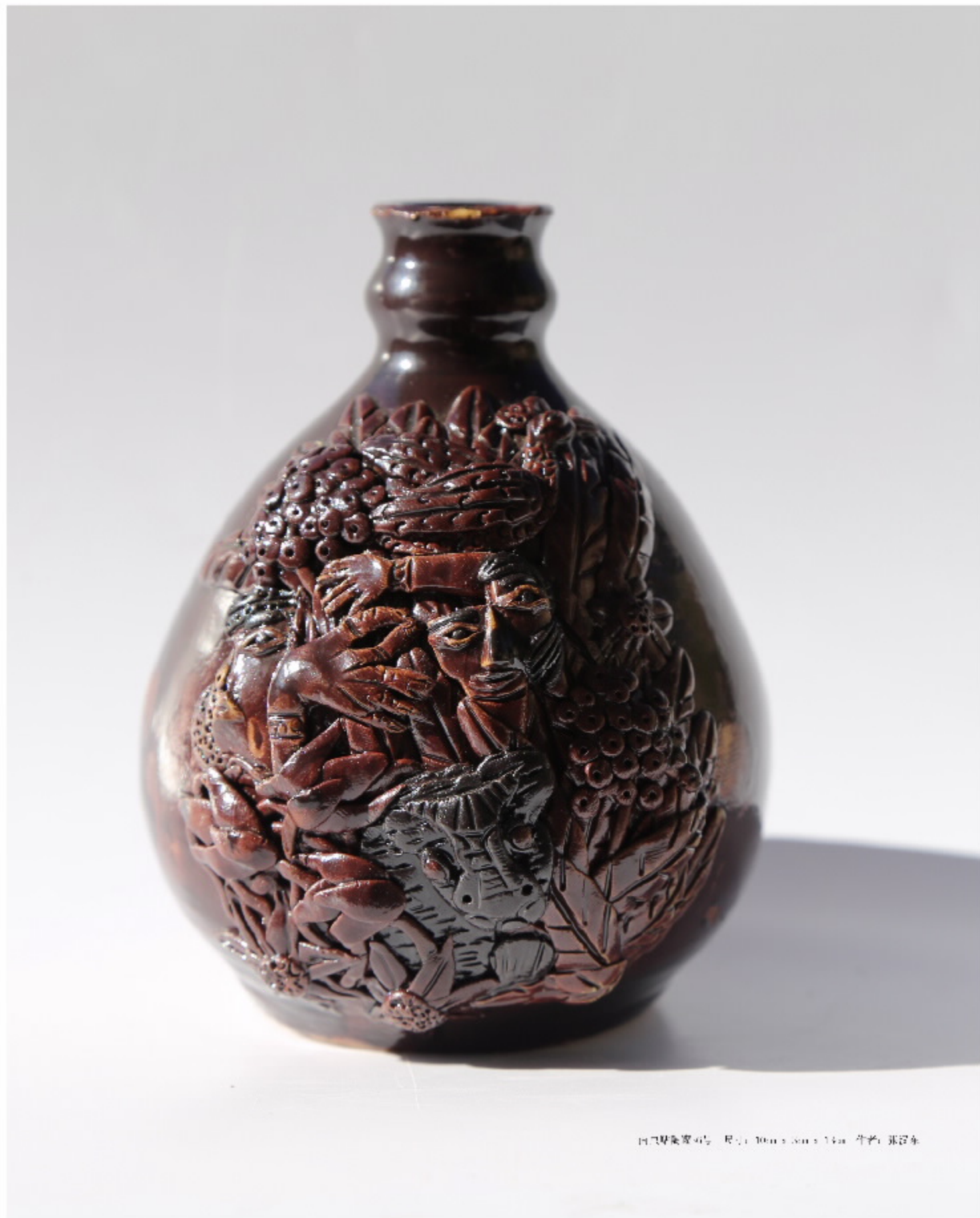
日月星辰瓷瓶 尺寸: 10cm x 8cm x 14cm 作者: 张汉东