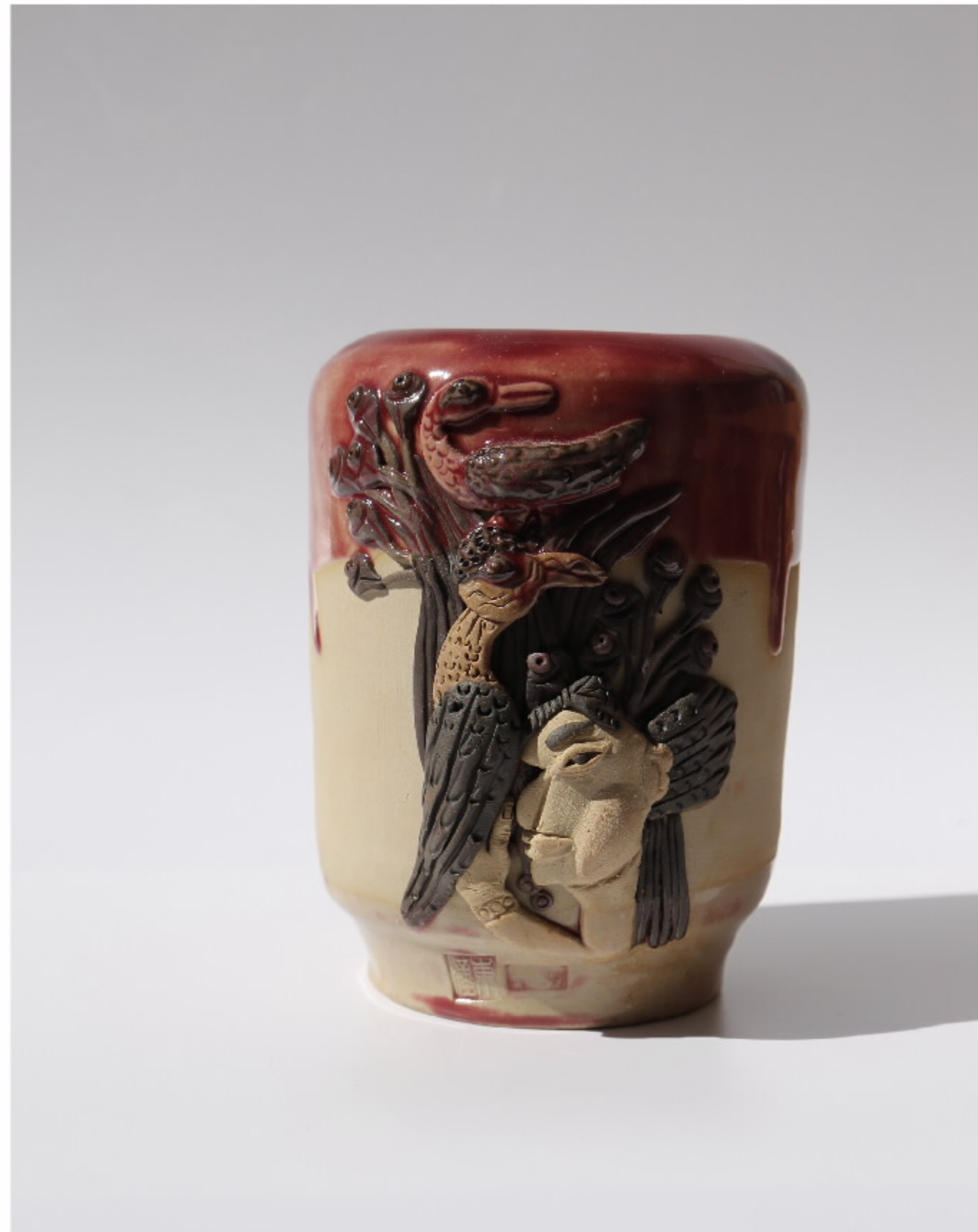
宝鸟雕竹雕碗 尺寸: 8.5cm x 8.5cm x 12cm 作者: 彭汉东