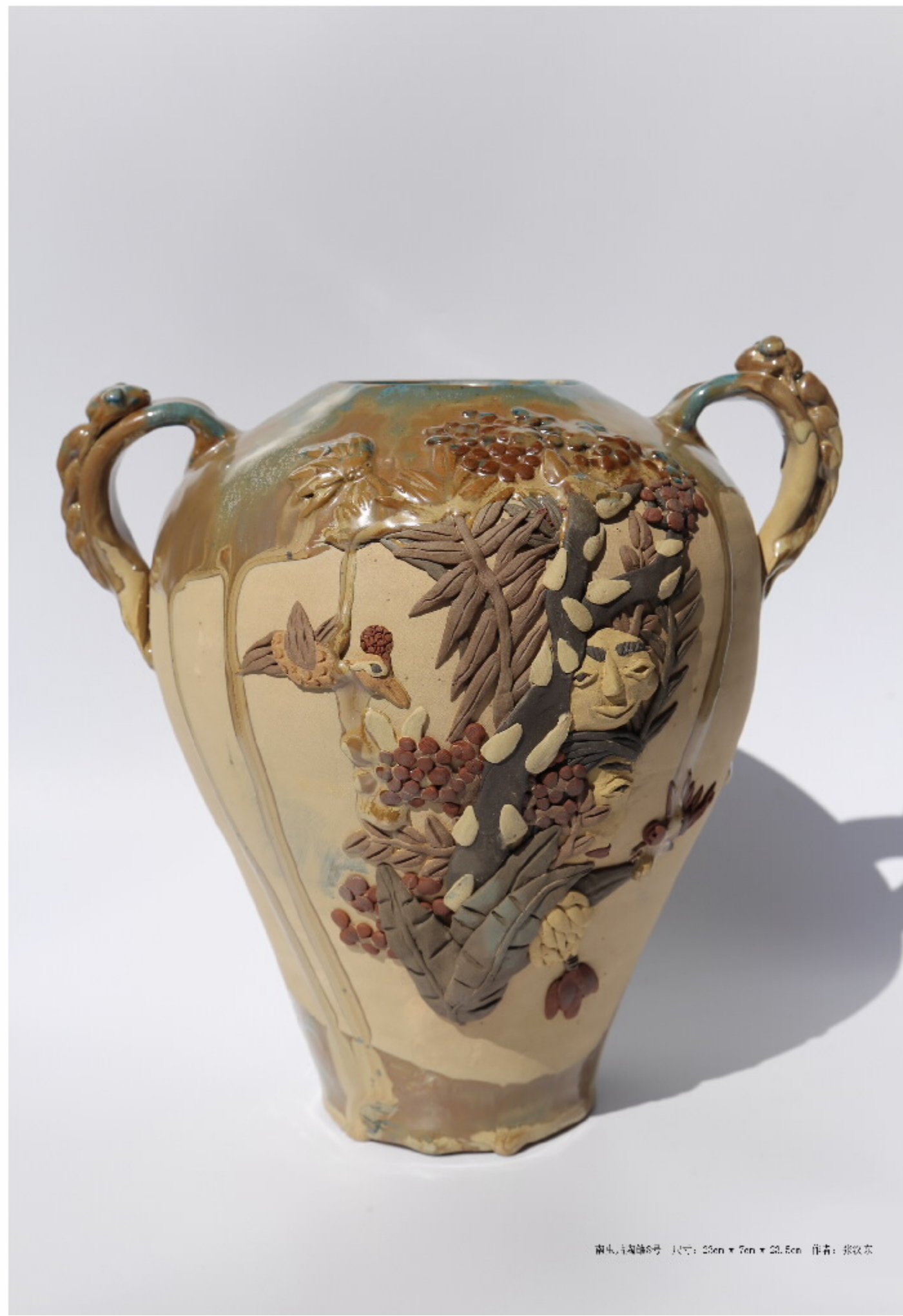
南水, 青瓷钵6号 尺寸: 20cm x 7cm x 20.5cm 作者: 张牧东