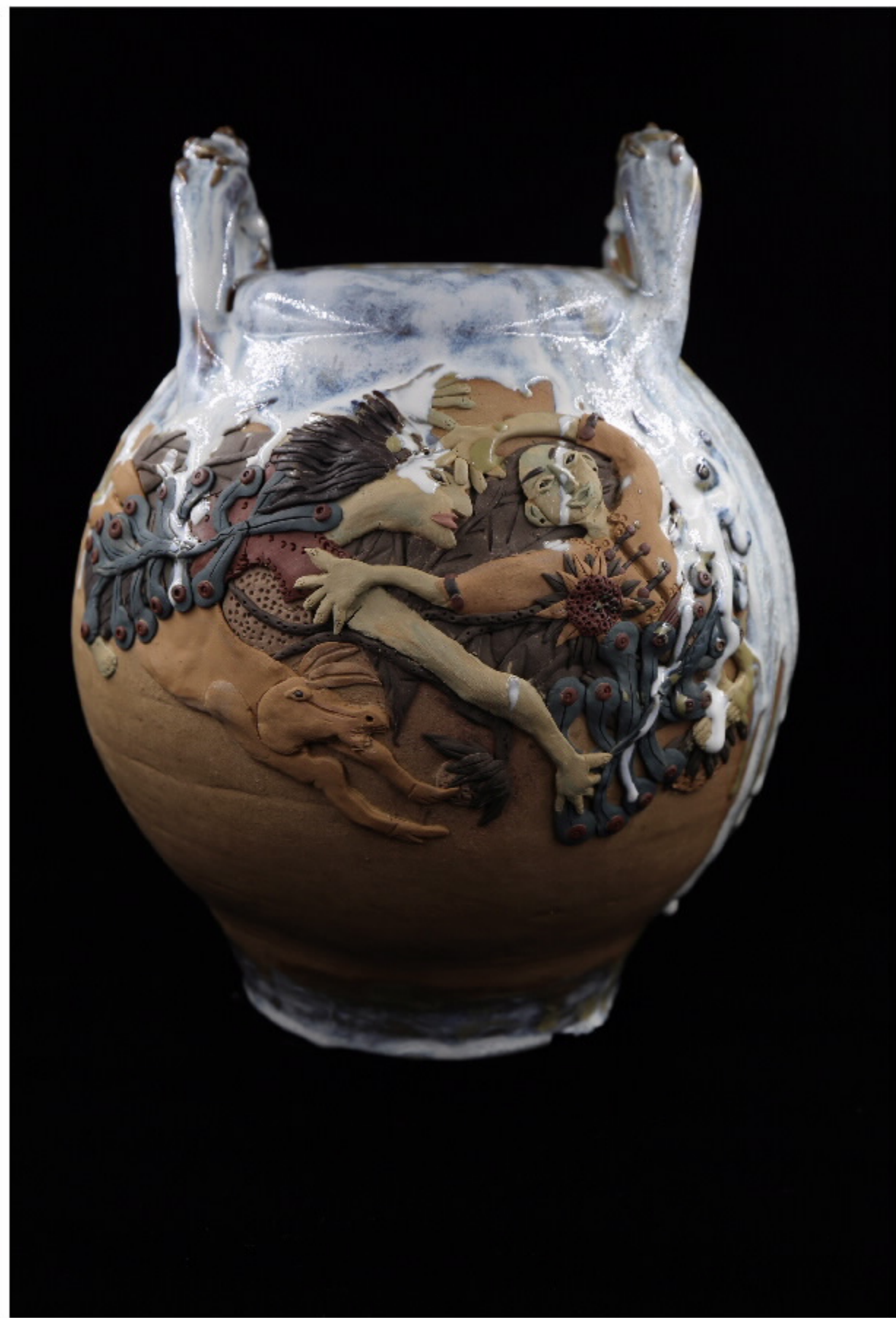
美索不达米亚陶器 尺寸: 31cm x 18cm x 32.5cm 作者: 张汉东