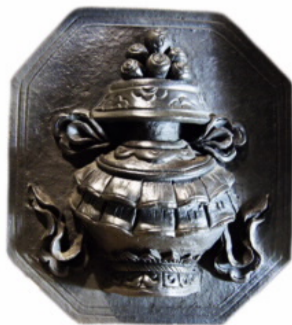
香格里拉尼西黑陶

南虫陶瓷艺术是在云南特有的建水紫陶、香格里拉尼西黑陶、新平傣族稻烧陶、华宁陶、易门青花、玉溪窑等地方工艺制作技术基础上，在和泥、拉坯、制型、造形、上釉以及烧制温度和产生窑变等过程中充分融入了南虫艺术的内容和精神，通过手工融色、自然拉坯、主题造型、创造肌理、艺术上釉，多次烧制，自然窑变等充满创造活力的艺术手法，形成南虫陶瓷艺术中不可重复的自然形状、丰富肌理、艺术窑变、高低混温及素烧上釉同体的特殊艺术效果，从而在泥与火的交融、釉与土的协同、刀与形的吻合、技与艺的交流中自然融入了南虫艺术主题内容，形成了南虫陶瓷艺术特有的乡土与现代结合、应用与艺术互通、激情与理智并用、朴素与华丽共存、本土与国际同在及表现主义方法与本土文化精神携手的艺术面貌，从而充分展现根与魂精神交融的南虫艺术文化内涵。目前南虫陶瓷艺术创作的主要表现形式有三种，其一是运用分形分色分别创作出独立造型并根据创作需要逐步粘贴于提前制作好的土陶器型上完成作品制作的方法，经过烧制上釉后完成的具有强烈浮雕感的贴陶艺术；其二是在根据具体创作需要而制作完成的器型上，直接应用雕刻的方式创作完成南虫刻陶艺术作品；其三是发挥中国传统水墨画方法而创作的南虫青花陶瓷艺术。南虫陶瓷艺术结合云南特色工艺创作的作品形式又具体分为南虫黑陶艺术、南虫玉溪青花、南虫华宁陶艺和综合创作的南虫陶瓷艺术；从烧制工艺中的上釉差异到作品呈现的艺术形式，按无釉、半釉和全釉分为，南虫素烧陶、南虫素釉陶和南虫陶瓷；按南虫艺术原则创作的不可重复的孤品艺术和通过现代技术可以批量生产的性能和形式分为南虫陶瓷艺术和南虫陶艺产品。