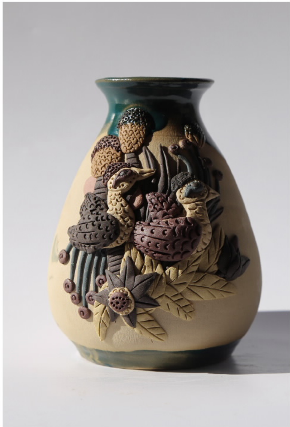
蓝色静观图 尺寸: 9.5cm x 11.5cm x 11cm 作者: 张汉永