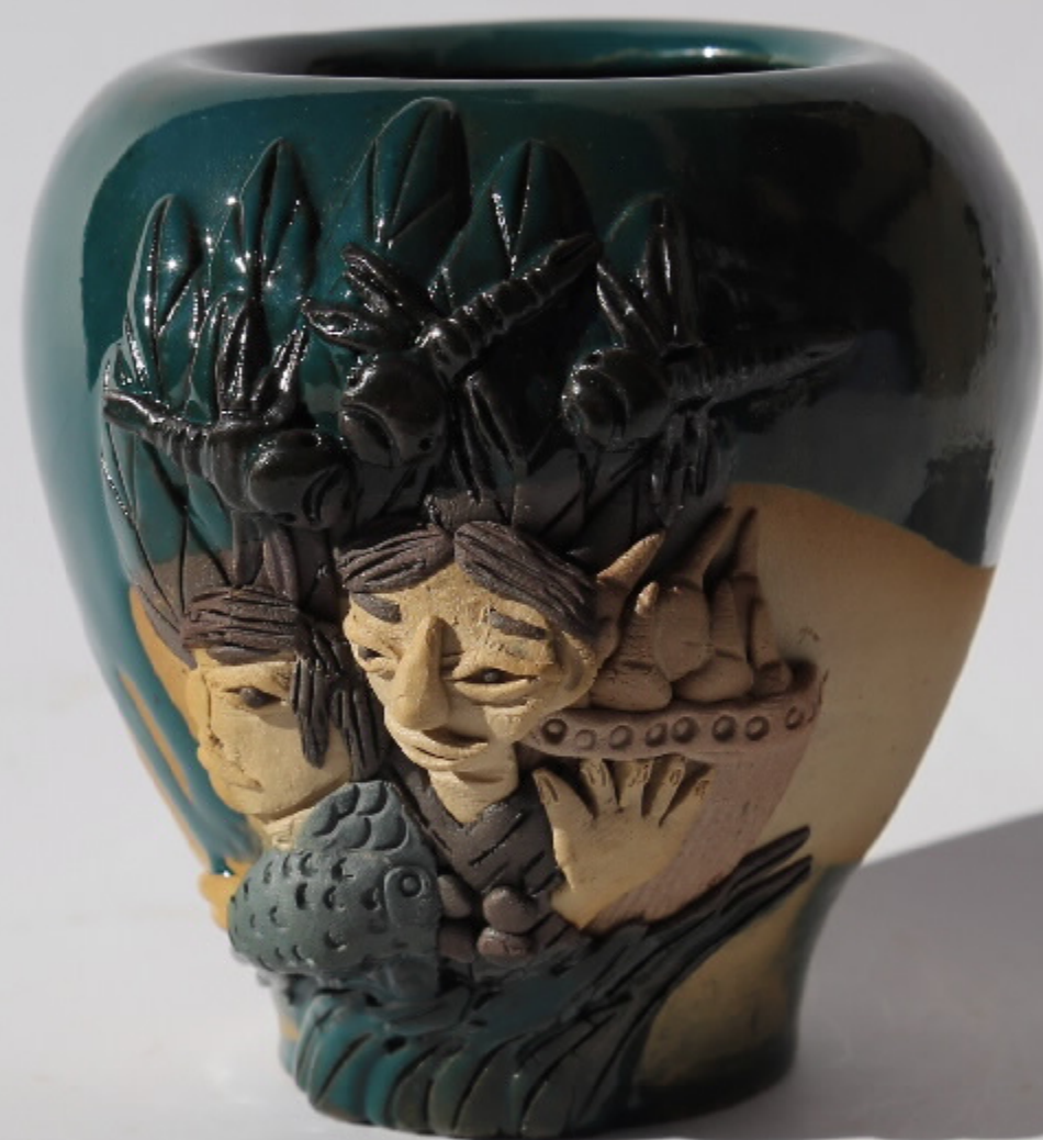
青白瓷刻花人物纹杯 尺寸：10cm x 5.5cm x 9.5cm 作者：张悦东