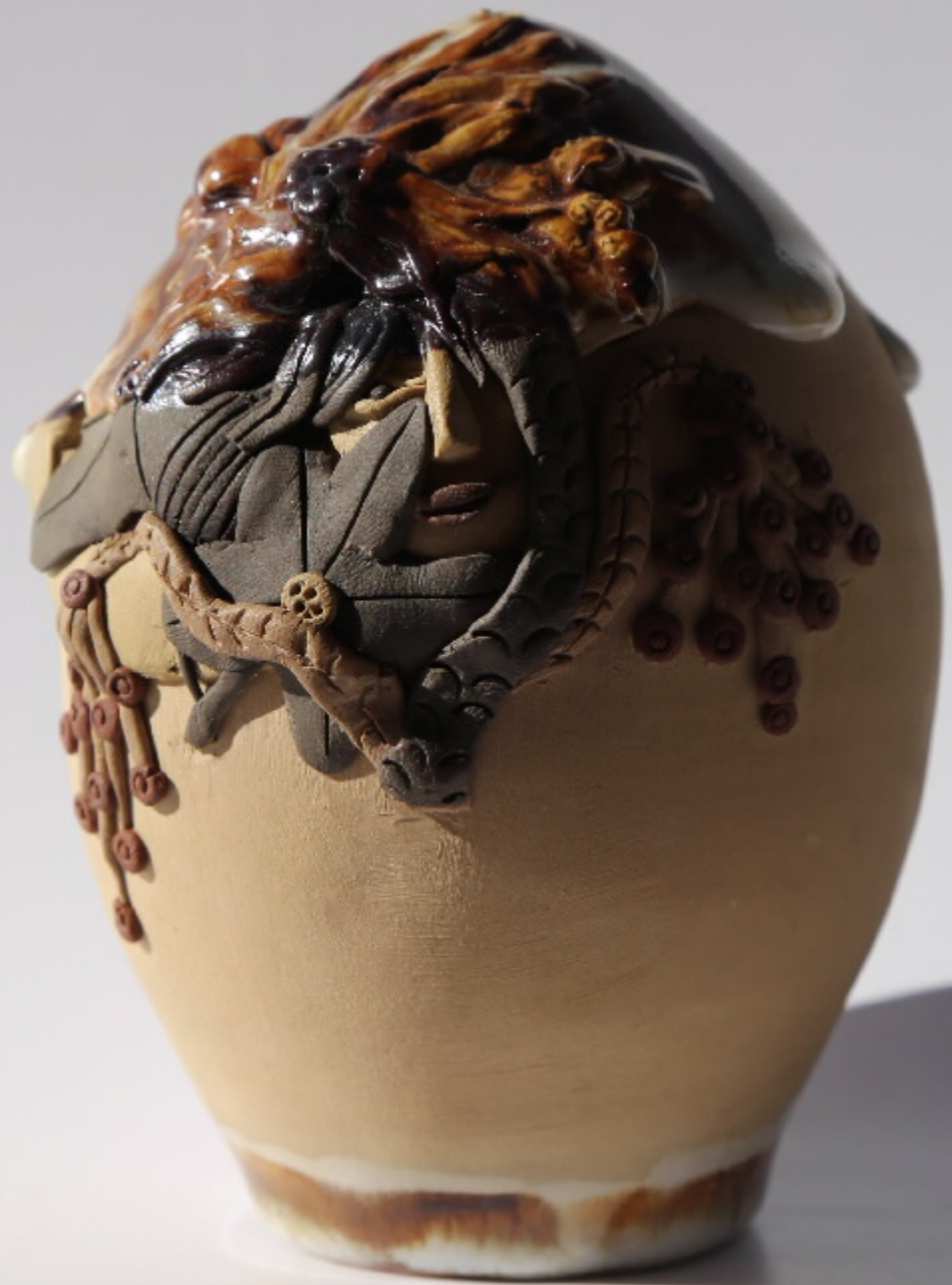
陶土雕刻的瓷瓶 尺寸: 9cm x 6.2cm x 11.5cm 作者: 张汉华