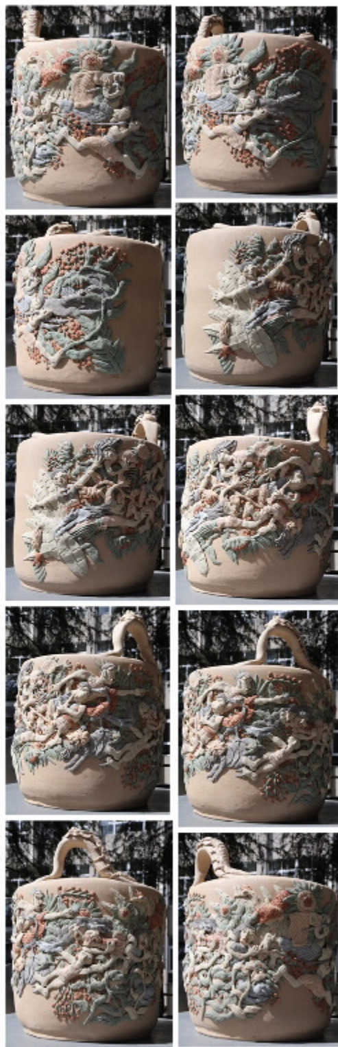
《山海经神兽》系列 尺寸：27.5cm x 21.5cm x 33cm 作者：叶茂林 2016年