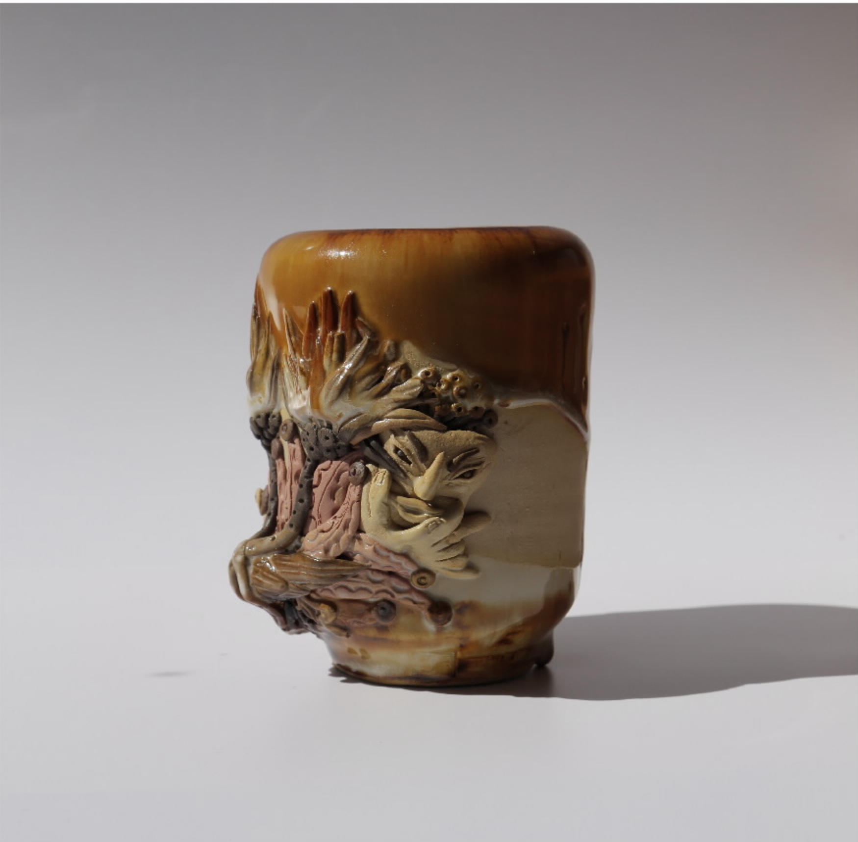
无虫雕竹雕碗 尺寸: 8.5cm x 8.5cm x 11cm 作者: 彭汉东