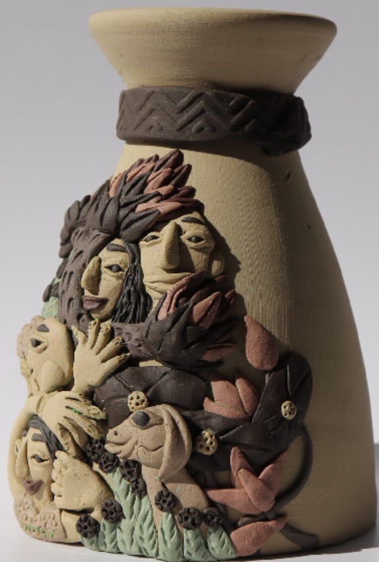
图式雕刻, 陶器, 尺寸: 31.0cm x 30cm x 13cm, 作者: 张强东