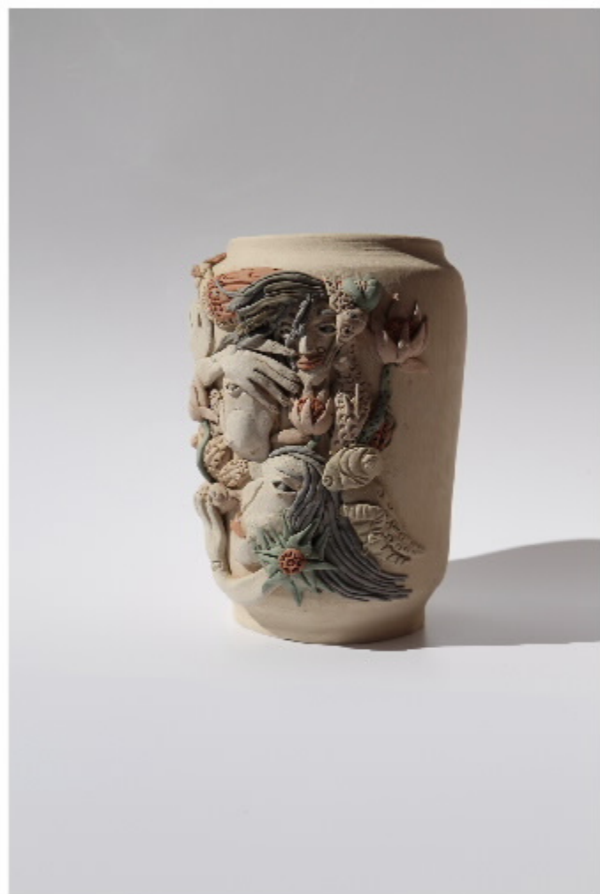
高克勤的罐(1) 尺寸: 8cm x 7cm x 12cm 作者: 高克勤