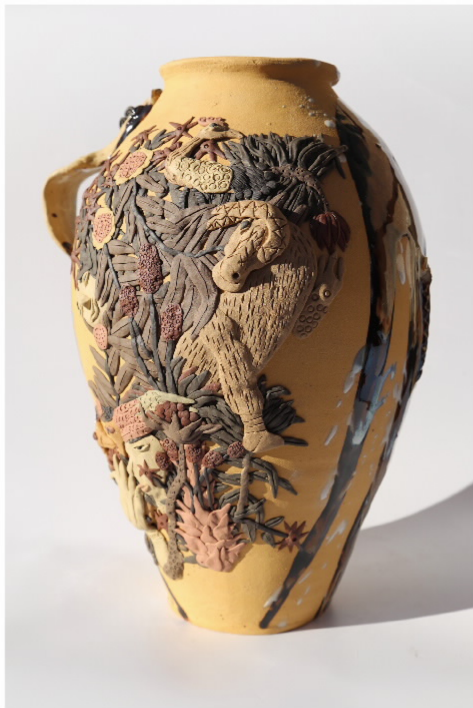
西昌黑陶第29号 尺寸: 23.5cm x 9cm x 33.5cm 作者: 张汉东