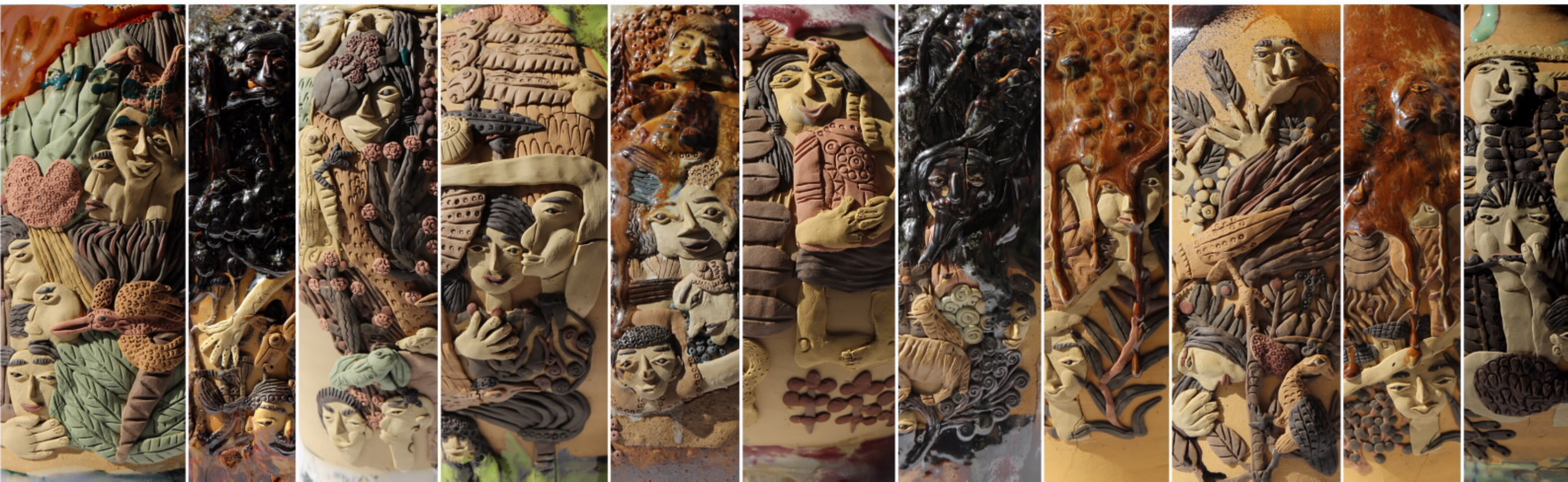
南虫陶瓷艺术浮雕系列作品之一 尺寸：10m x 3.1m 作者：张汉东 2016年

艺术创作与实践，又因生于抚仙湖畔长于云南大地，真实的感受到澄江抚仙湖的魔幻，江川李家山青铜器的神奇，怒江傈僳族喉颤的震撼，文山壮族坡雅歌书的空灵，楚雄彝族十月太阳律的绝妙，香格里拉雪山的梦幻等重要本土元素对于内在性灵的呼唤和影响，潜意识的在创作中赋予生命力度和抚仙文明的创作源泉。多年的艺术探索，于地寻找灵魂深处的艺术过程中，应用艺术语言充分享受对万物有灵的虔诚信仰并自信的沐浴在本土文化为根的表现主义艺术风格中的同时，以吴哥窟原始宗教、敦煌藏传佛教和玛雅原始哲学等文明下产生的艺术形式所呈现出来的文化震撼相比较形成了深厚性缺失的巨大遗憾，带着纠结和矛盾的心理一路跋涉。