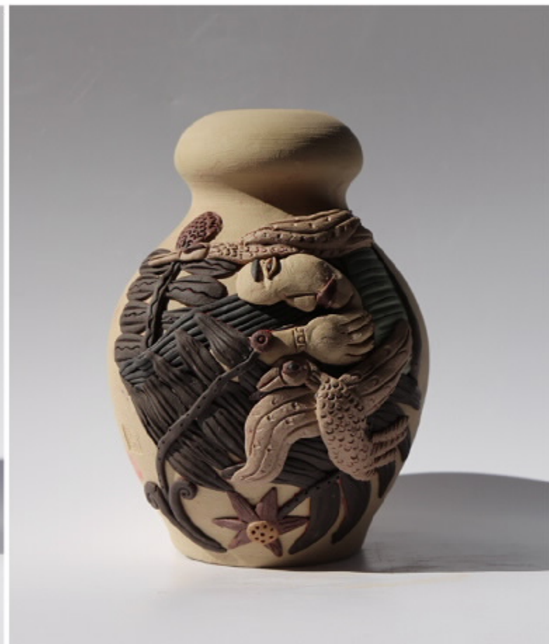
《渔翁的梦》102号 尺寸: 10.5cm x 3.5cm x 12cm 作者: 张汉东