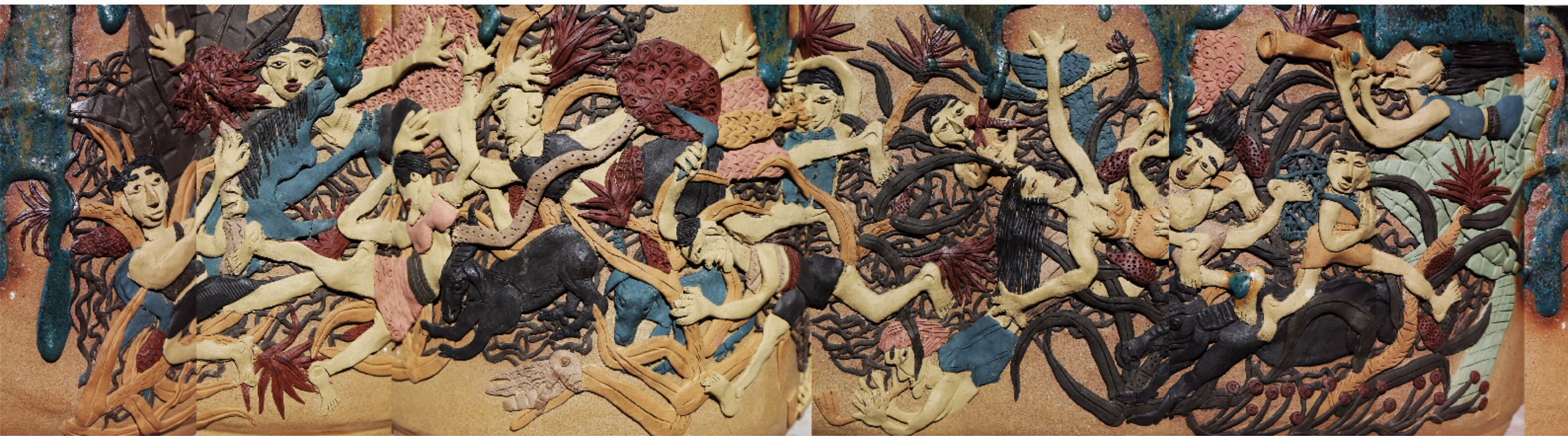
西汉之六彩陶器(1970号—1号) 作者：张汉东 年代：1916年