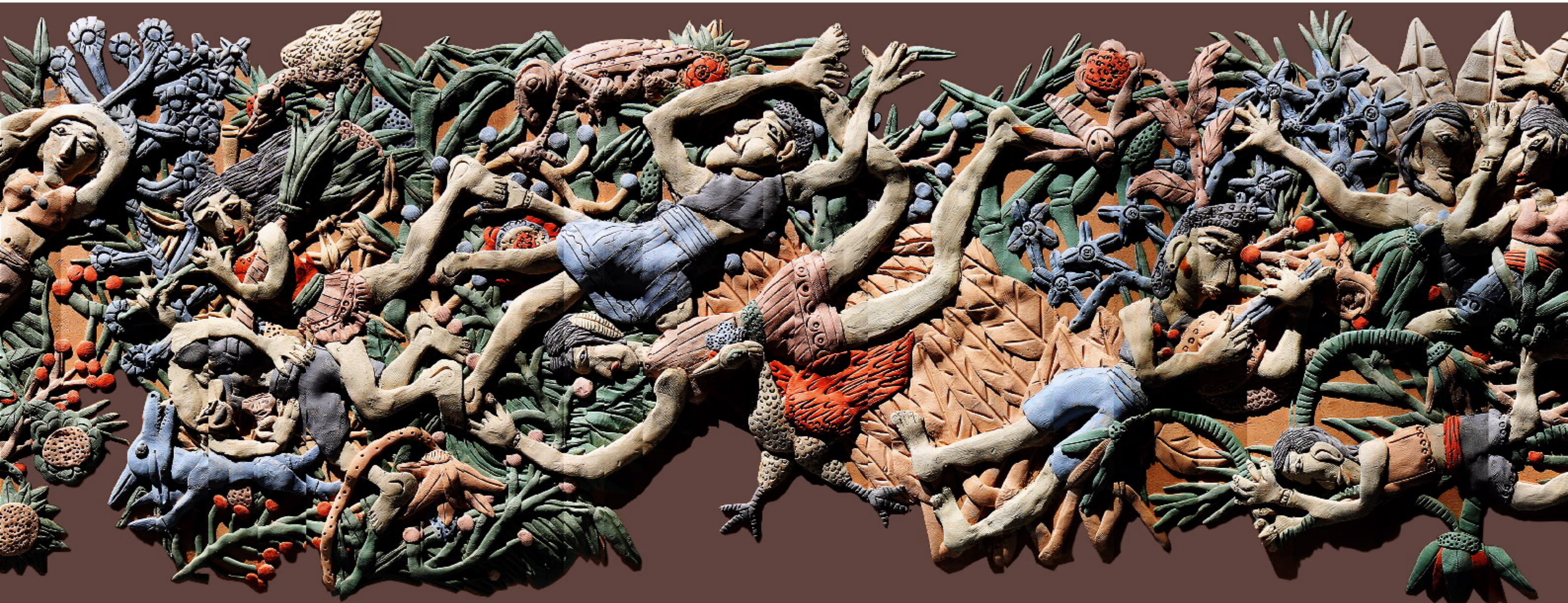
兵马俑水陆攻战陶俑（局部），西汉中期，约公元前200年