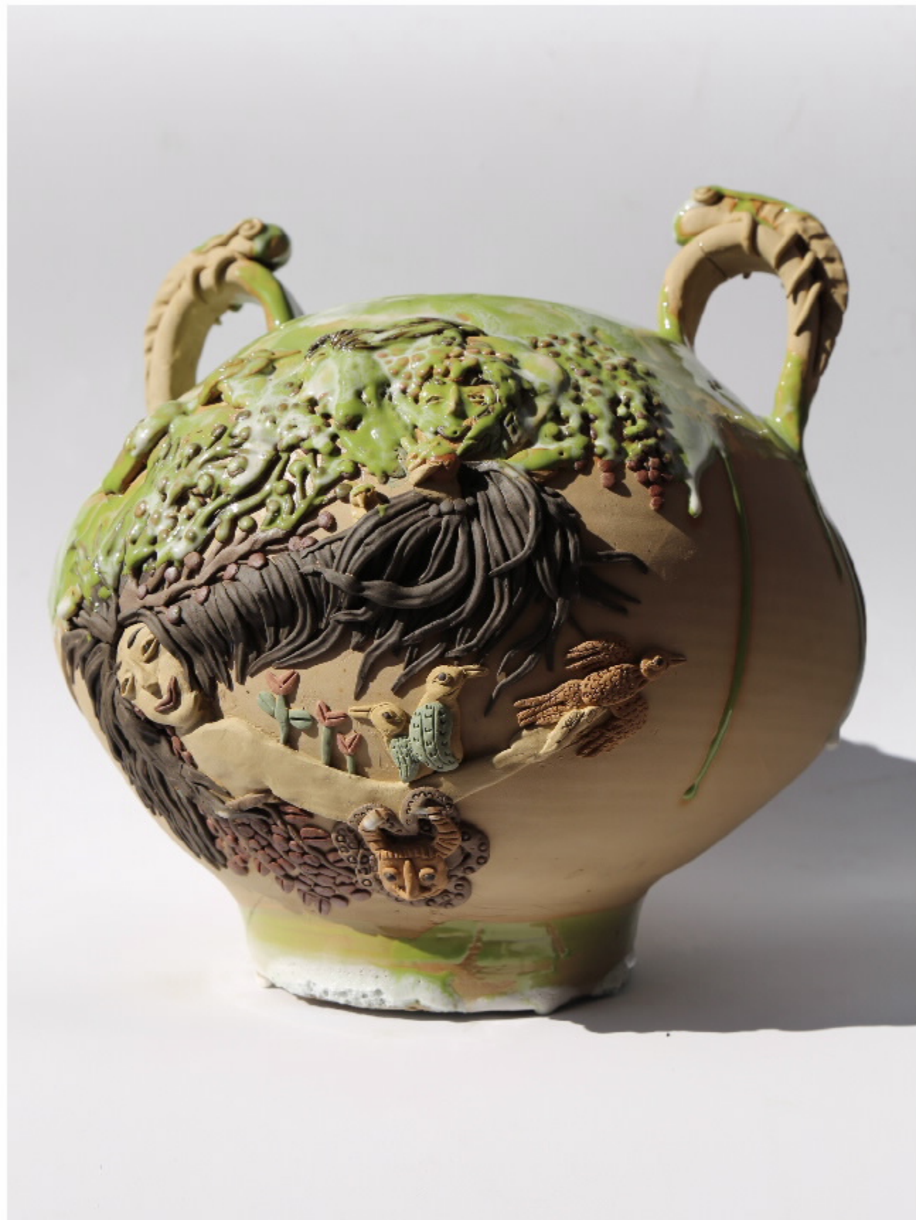
七火陶器1号 尺寸: 31cm x 30cm x 30cm 作者: 张汉东