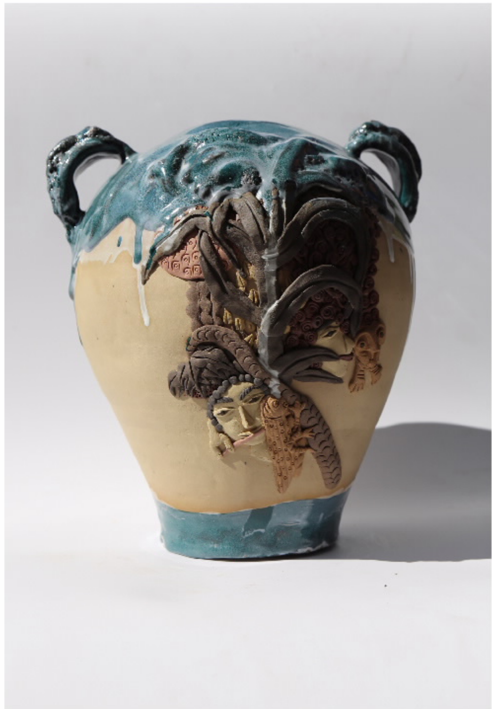
虎山龙影119号 尺寸: 20cm x 17cm x 21.5cm 作者: 张悦来