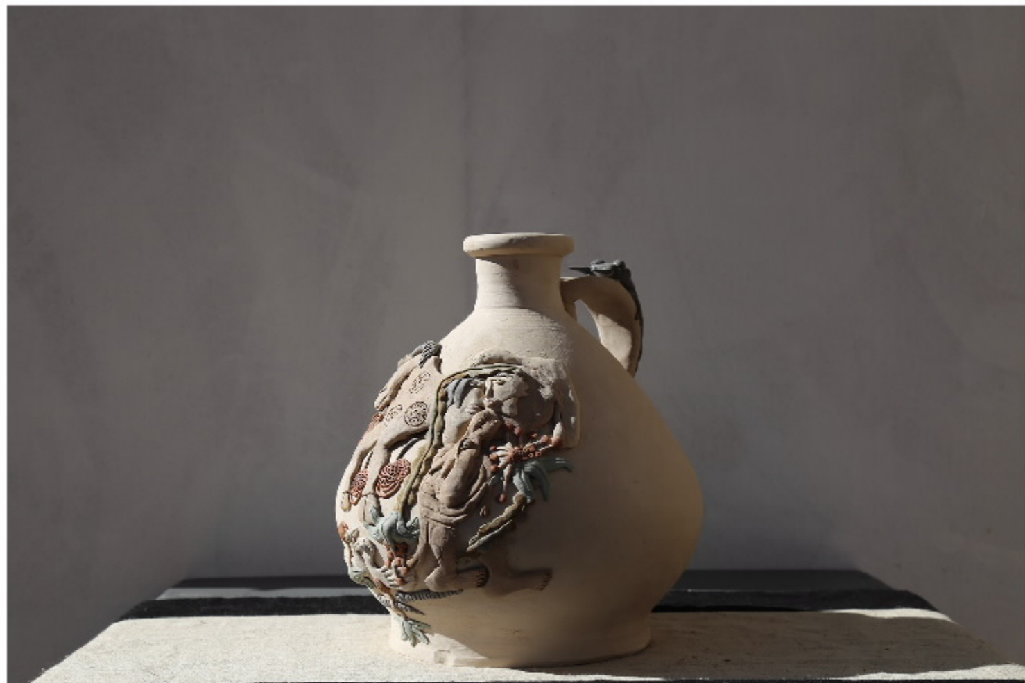
西工博藏05 | 尺寸: 20cm x 4.7cm x 12.7cm | 作者: 张法华