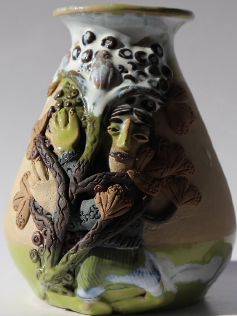
西山泥塑群10号 尺寸: 9.5cm x 5cm x 11.5cm 作者: 姚汉东