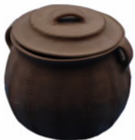
新平花腰傣稻烧陶