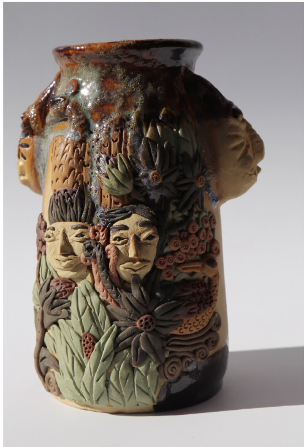
四季静观图 尺寸: 12cm x 30cm x 13cm 作者: 张汉永