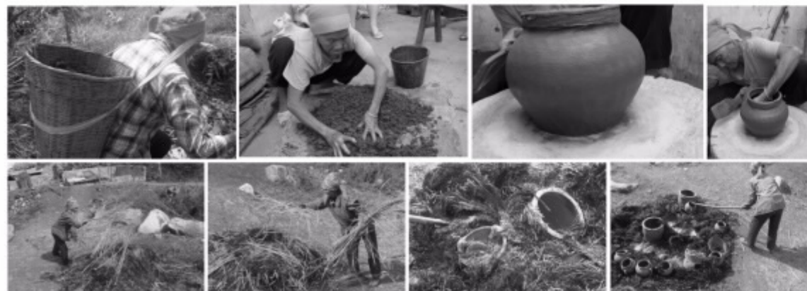
新平花腰傣稻烧陶制作烧制过程

南虫陶瓷艺术从创作动机到作品形式，在充分体现其南虫艺术核心价值特殊意义的同时，也正好形成当今社会文化产业急需的的创新成果，因此南虫陶瓷艺术不可避免的产生了对于南虫艺术发展建设中的服务性、开创性和必要性；地方工艺和本土文化学术建设中的艺术拓展性、独特创造性和不可替代性；社会推广中及时有效的产生文化繁荣、文化创新和文化产业发展的文化精神性，同时随着南虫陶瓷艺术的调查、研究、传承、教育、创新、产业等创作体系的形成，也就自然而然的围绕陶瓷艺术形成了相应的分析研究、艺术创作、创意创新、情景教育、参与体验、能力形成、美育实践、旅游开发的艺术成就与文化繁荣的共同发展。