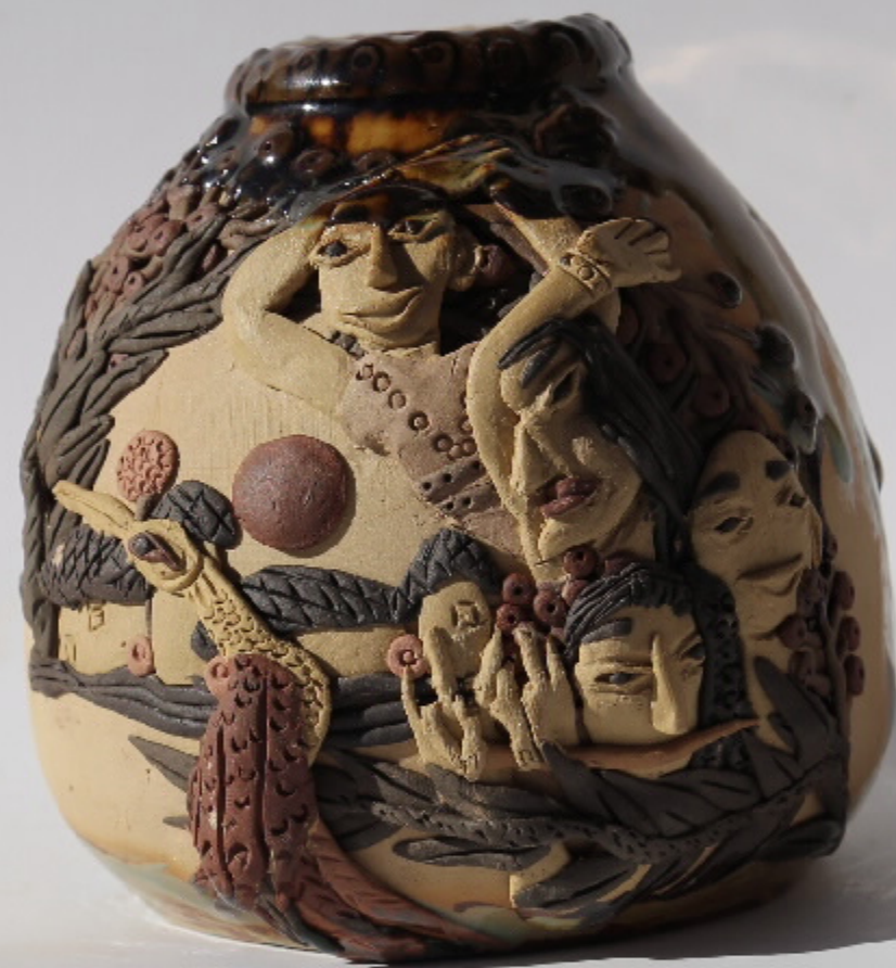
西山泥塑群11号 尺寸: 9cm x 8.5cm x 11.5cm 作者: 姚汉东