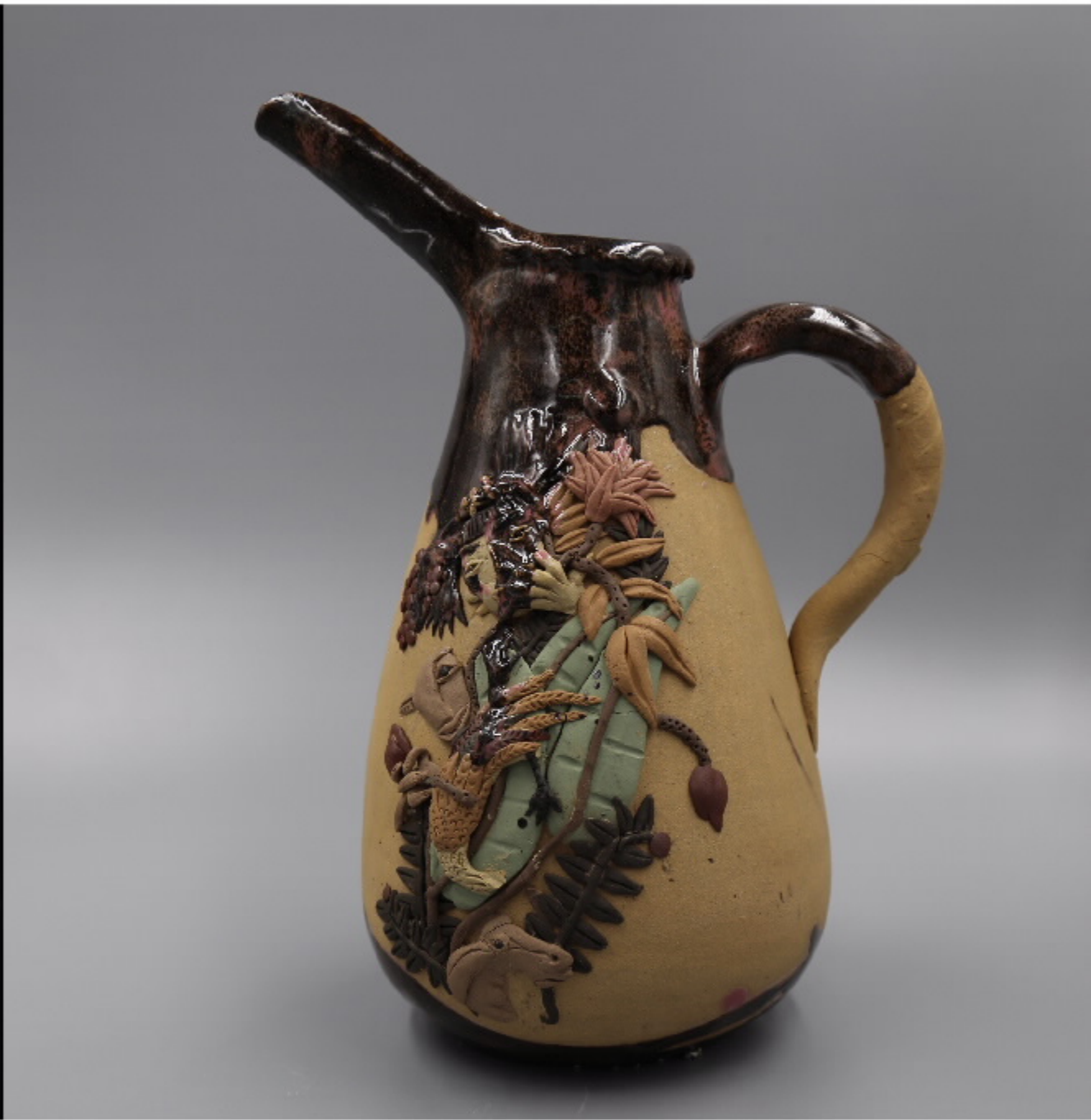
南美洲的陶器 尺寸: 20.5cm x 4.5cm x 20.5cm 作者: 张汉东