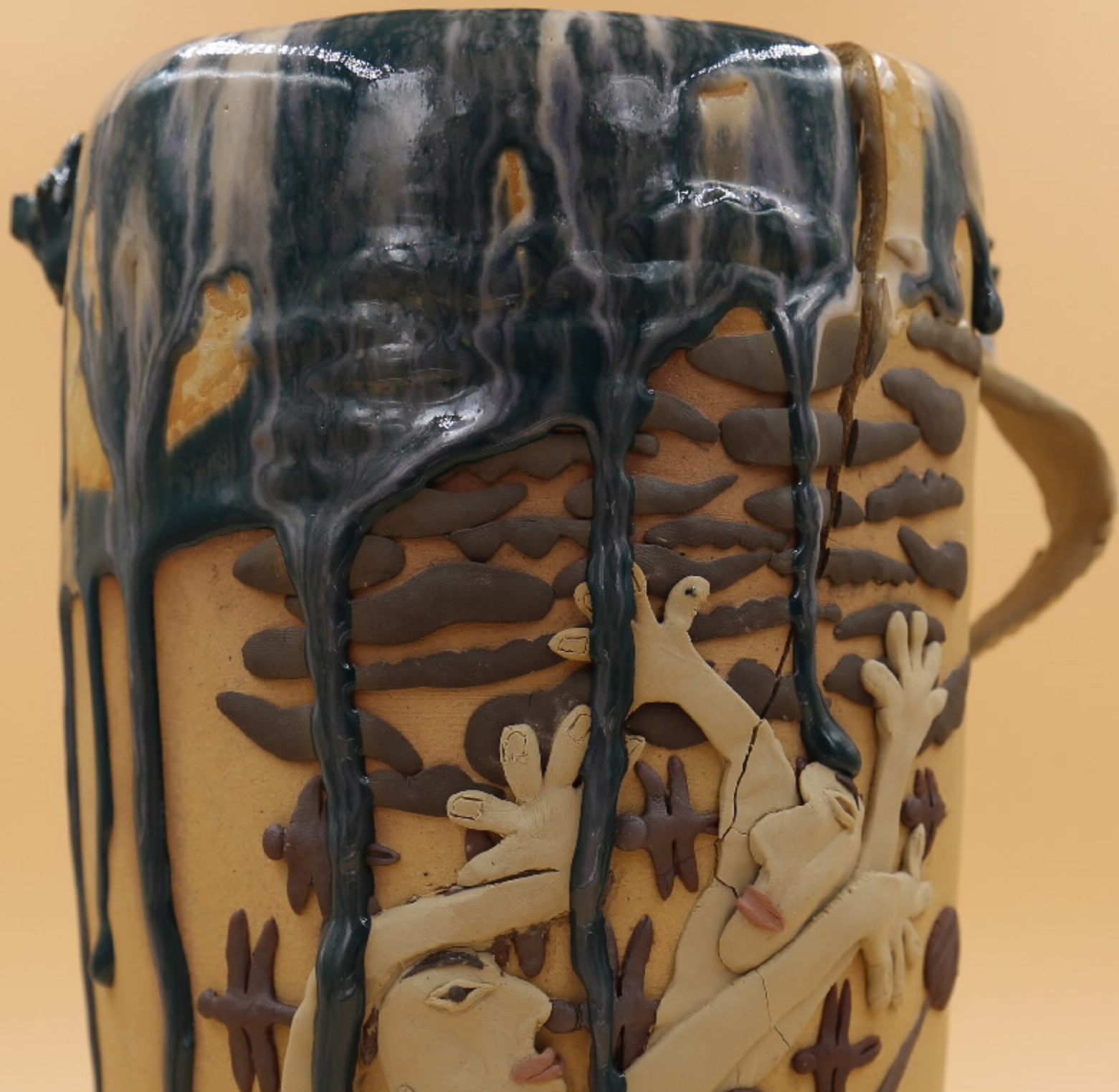
南京陶器博物馆藏 尺寸: 45cm x 30cm x 25cm 作者: 张淑云