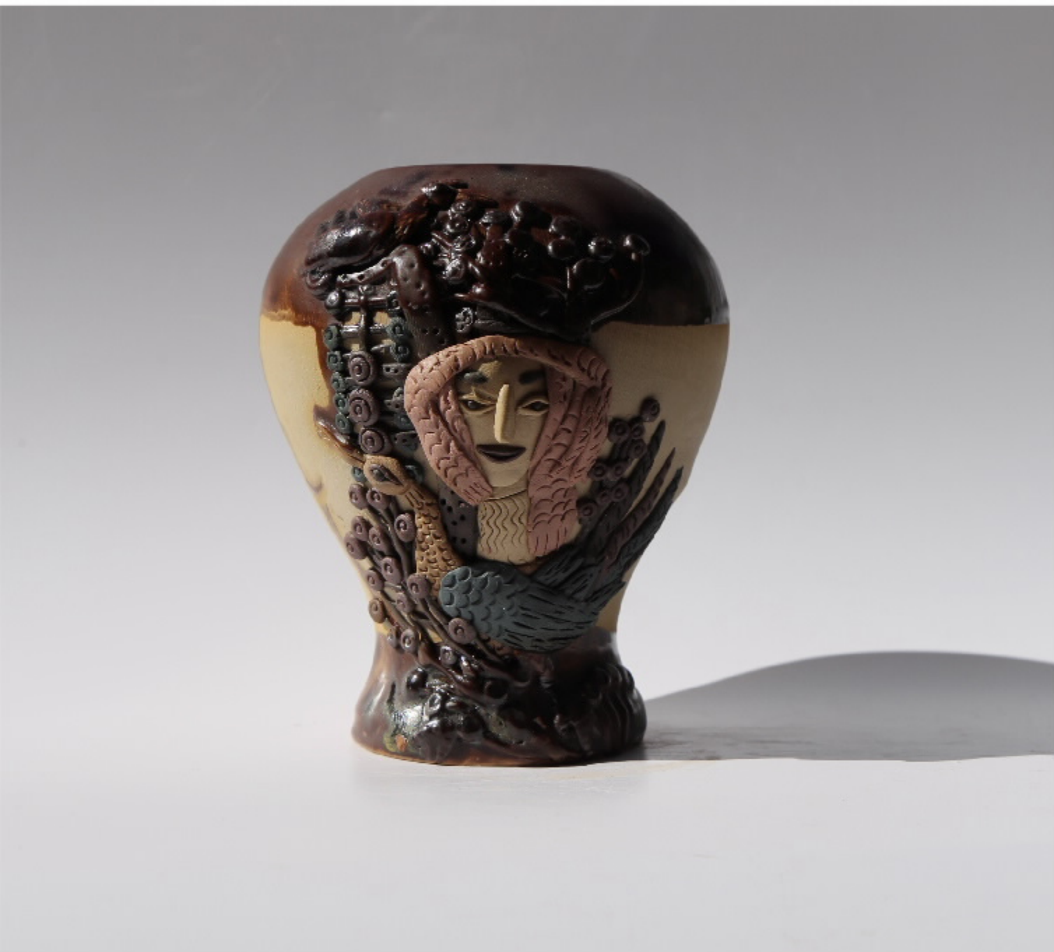
瓷山影竹第99号 尺寸: 10cm x 5cm x 12.5cm 作者: 张汉东