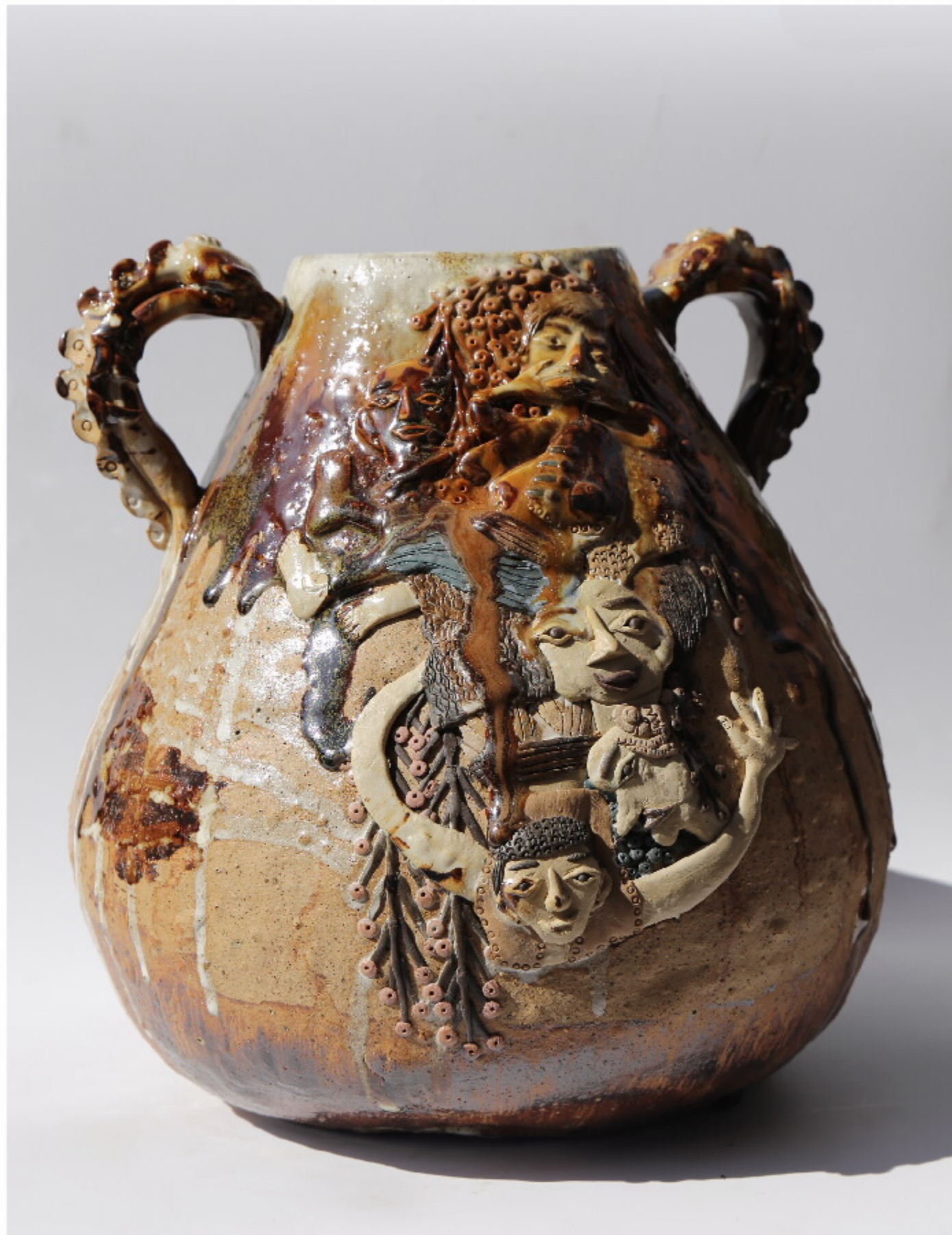
《秋乐图》陶器号 尺寸: 29.5cm x 33.5cm x 28.5cm 作者: 张敬东