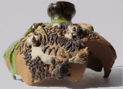
南山后陶窑22号 尺寸: 27cm x 6cm x 15.6cm 作者: 陈秋林