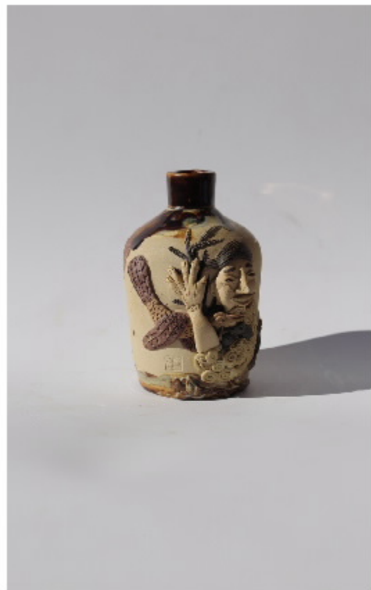
南山后陶器编号 尺寸: 5cm x 2.5cm x 1.2cm 作者: 张汉东