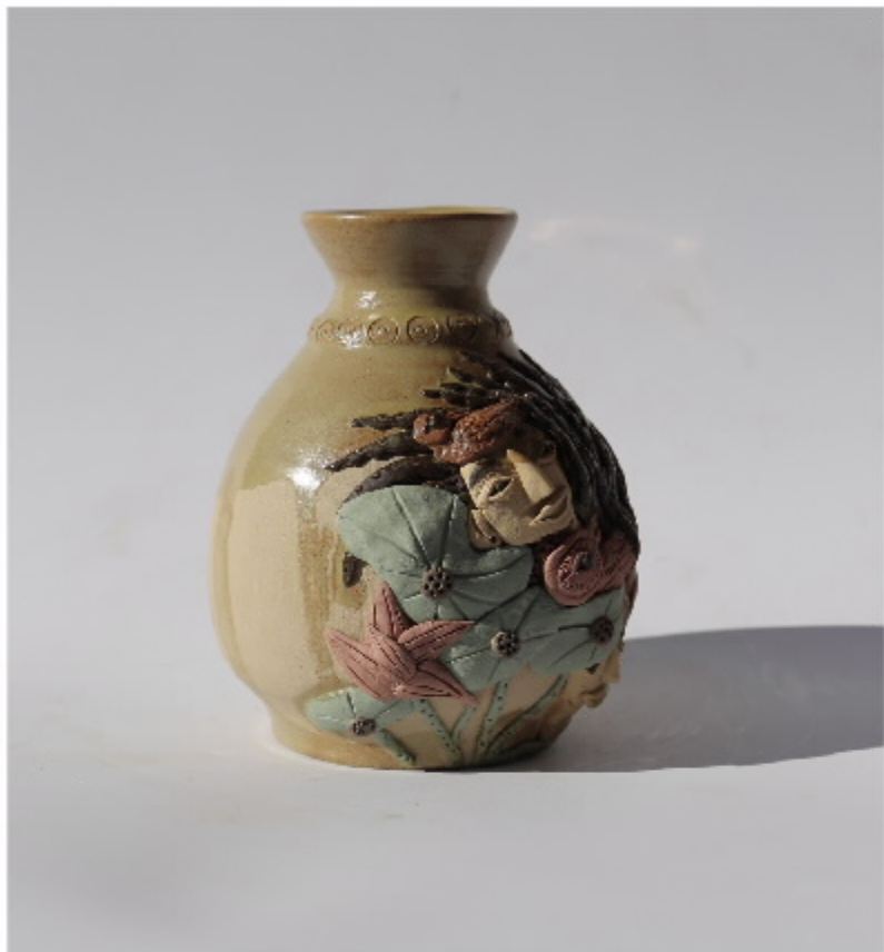
虎头瓶的局部图 尺寸: 8.5cm x 4.5cm x 11.5cm 作者: 张汉家