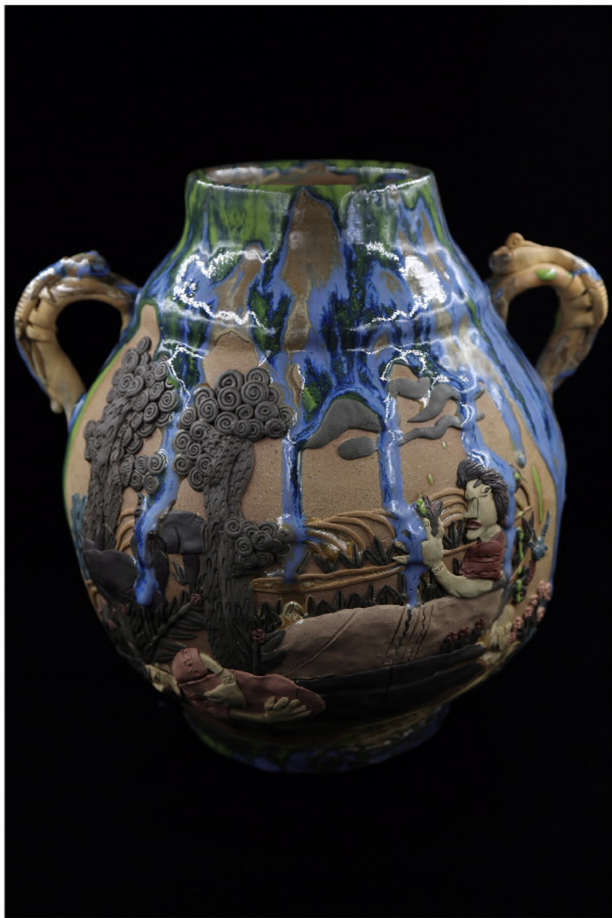
青瓷彩陶罐，尺寸：29.5cm x 19.5cm x 11.5cm 作者：张汉东