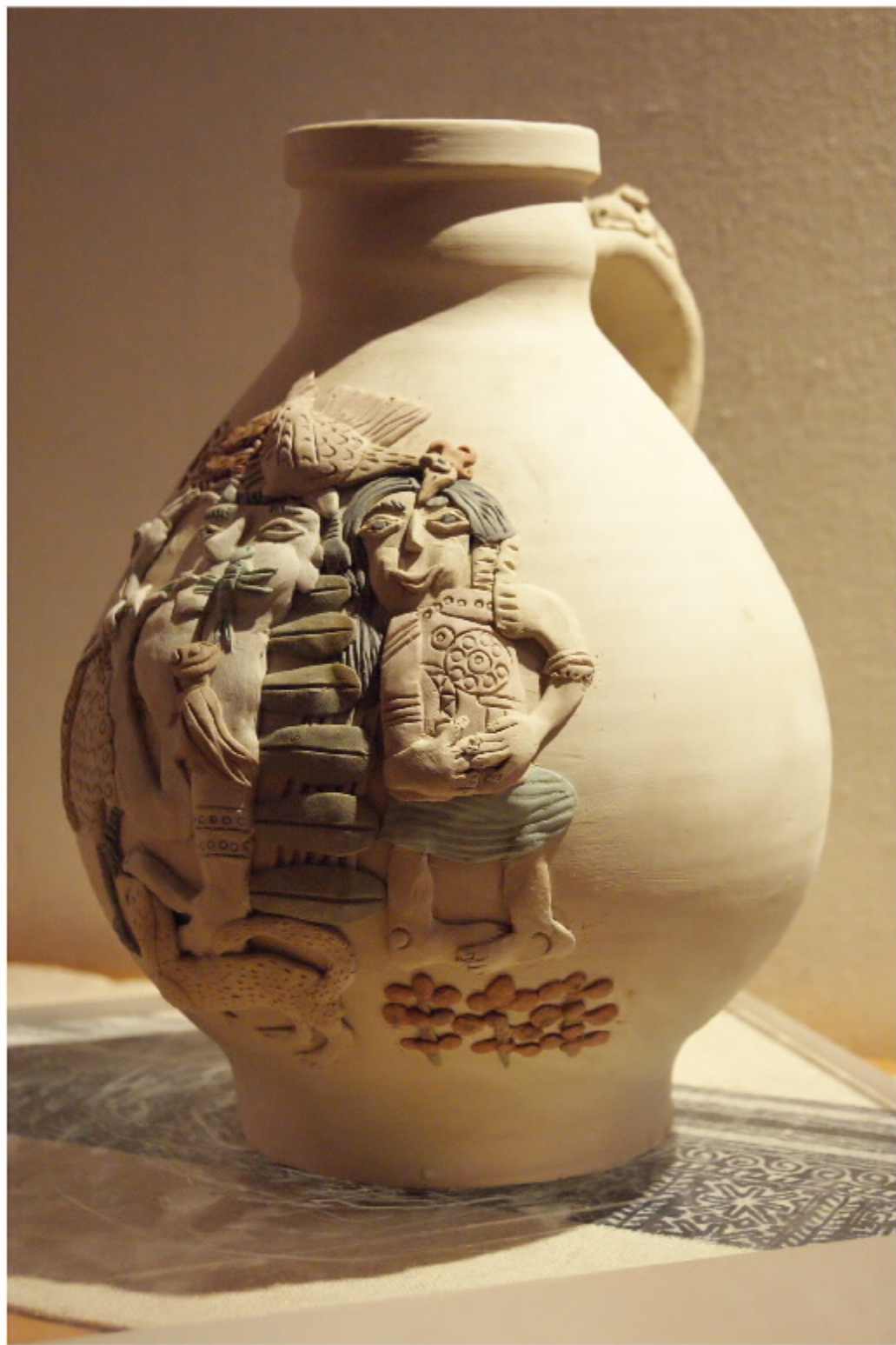
《鱼鳞陶11号》 尺寸: 21.0cm x 16.0cm x 26.0cm 作者: 张汉东