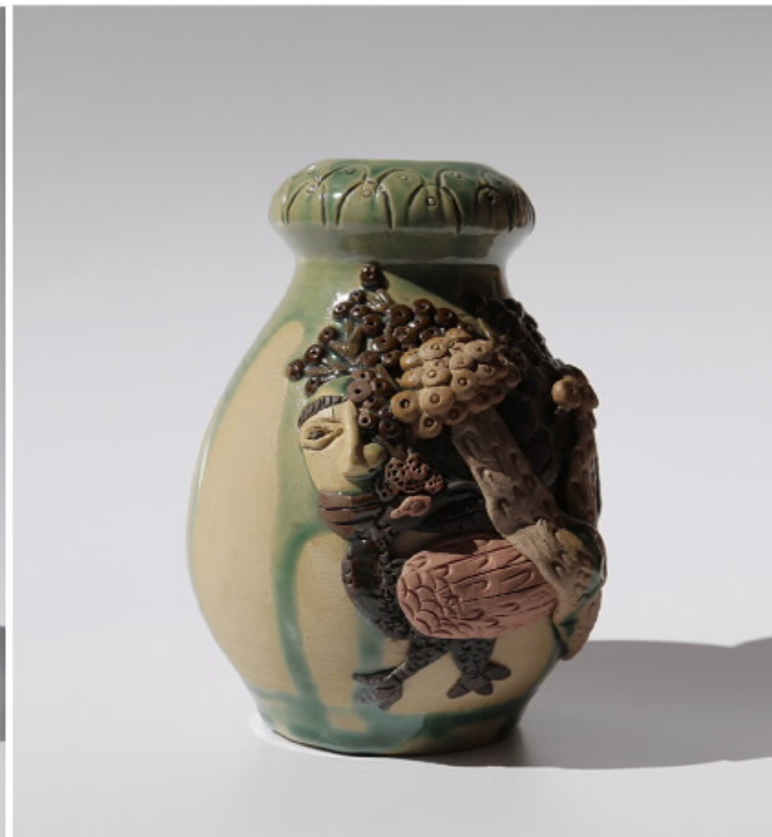
《渔翁的梦》103号 尺寸: 10cm x 3cm x 12cm 作者: 张汉东