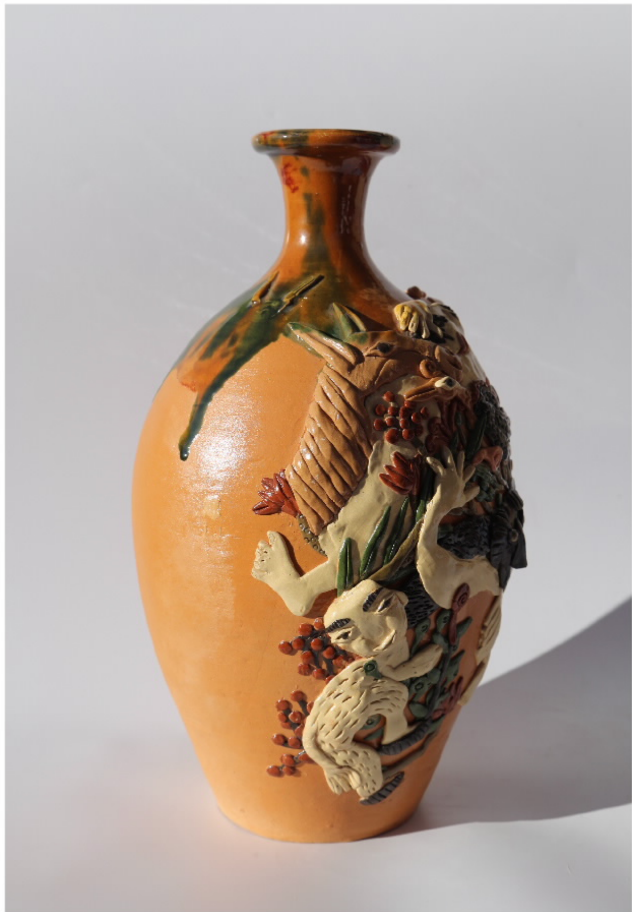
何山越陶器系列 尺寸: 18.5cm x 6cm x 32cm 作者: 施汉东