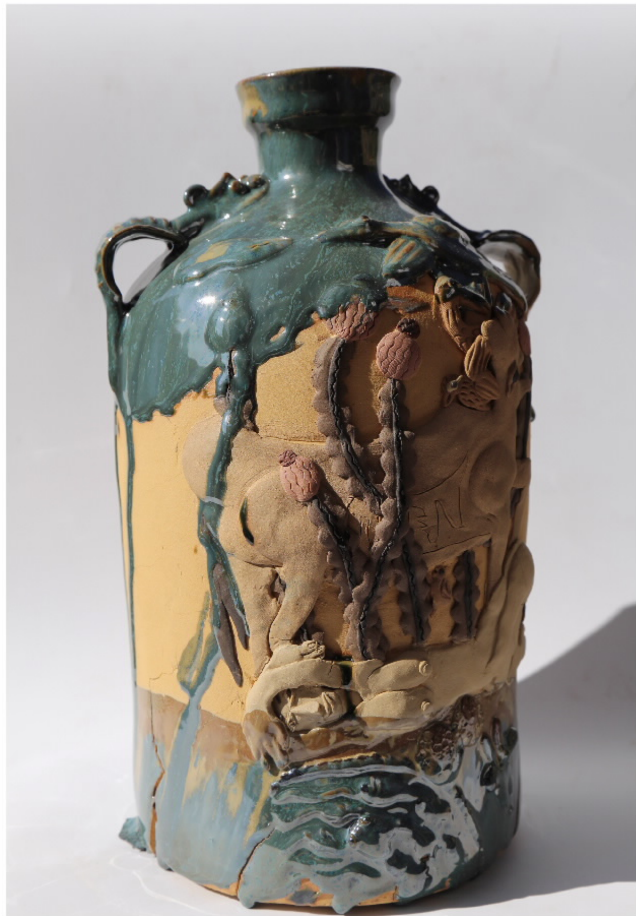
虎山魁的轴18号 尺寸: 19.5cm x 5.5cm x 33.5cm 作者: 张汉东