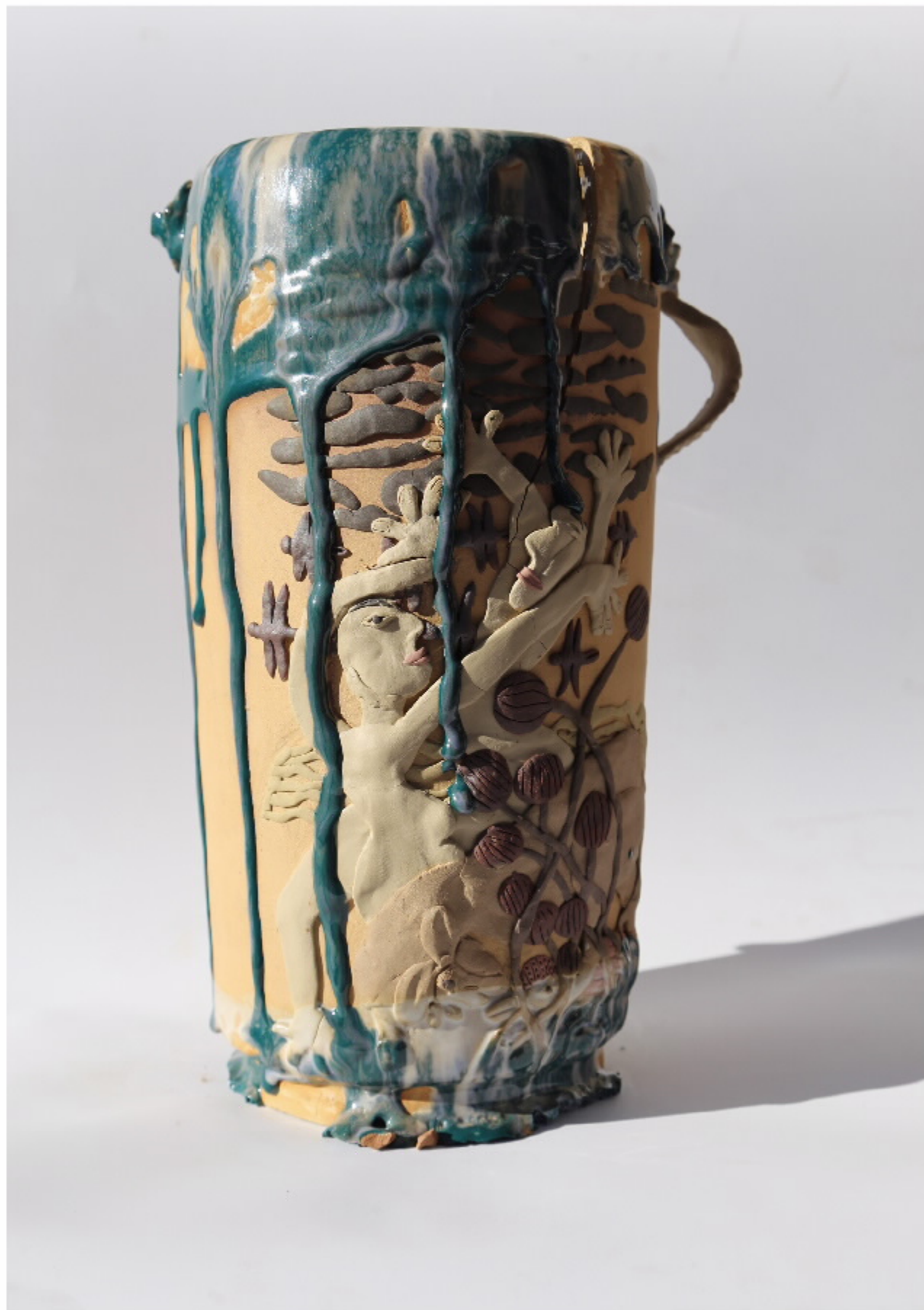
宝虫的轴17号 尺寸: 21cm x 16.5cm x 32.5cm 作者: 张汉东