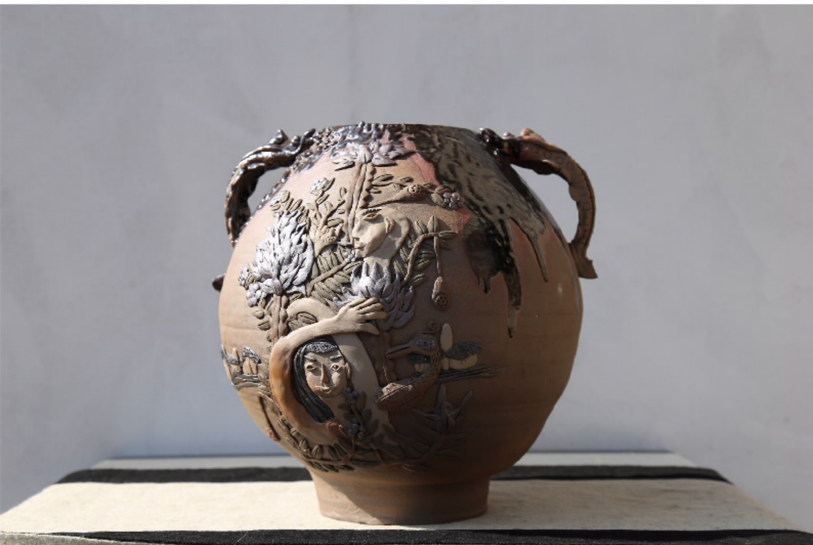
七山果的陶器号 尺寸: 25cm x 18.5cm x 21cm 作者: 张欣春