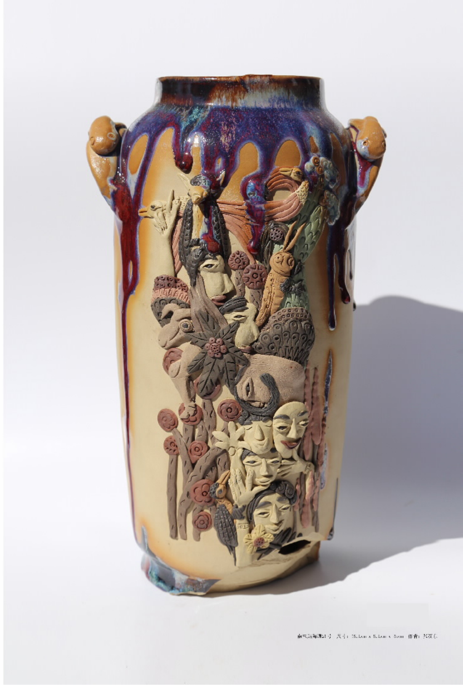
南岛海陶器1号 尺寸: 28.5cm x 18.5cm x 13cm 作者: 张双石