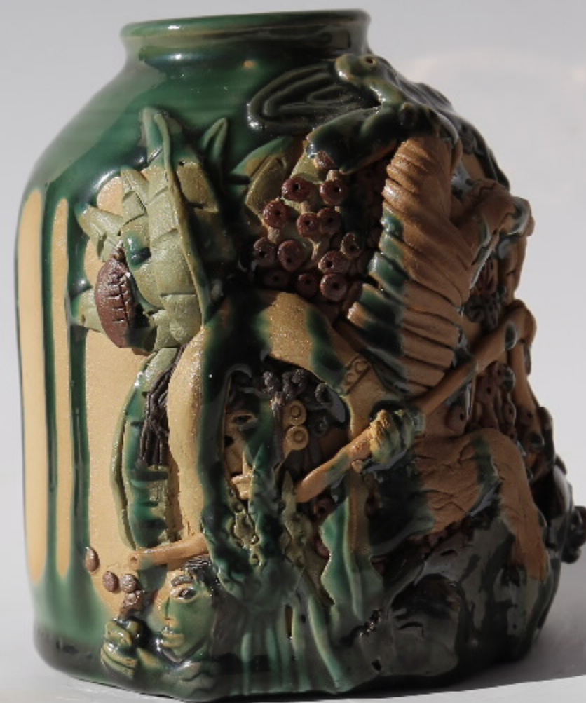
作品：张汉东 尺寸：10.5cm x 8cm x 12cm