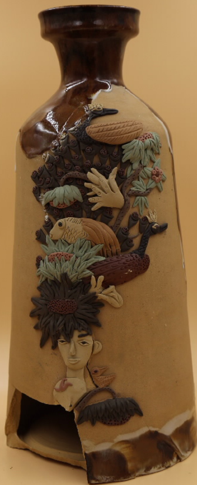
白浪潭茶壶(局部) 尺寸: 20cm x 7cm x 37cm 作者: 张汉东