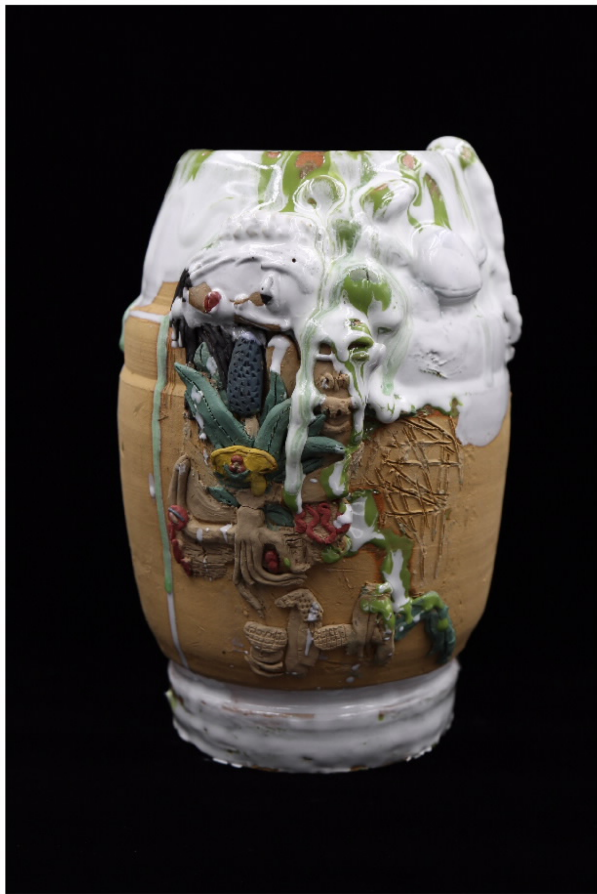
青瓷彩陶罐，尺寸：11cm x 11.5cm x 21.5cm 作者：张汉东