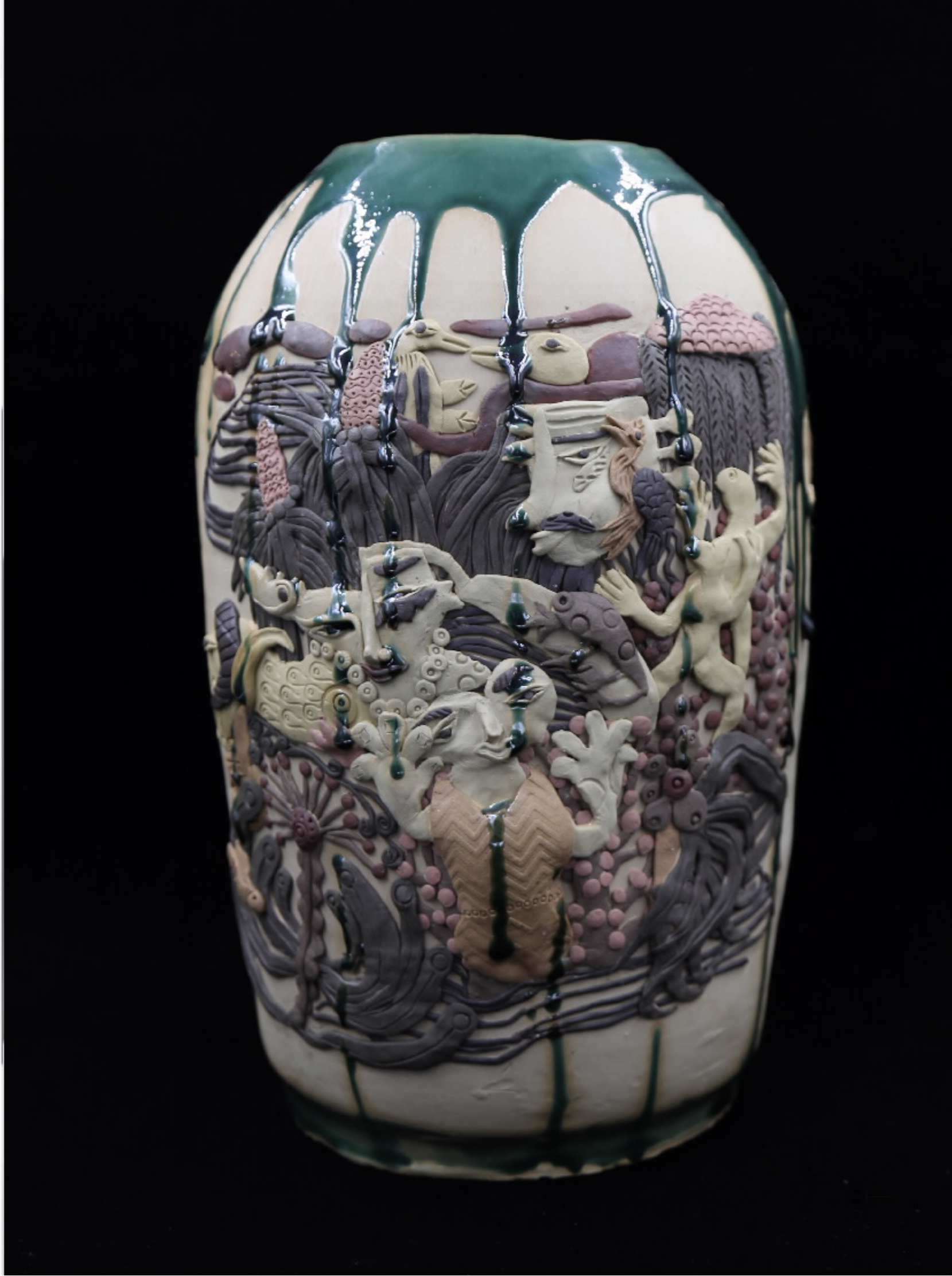
青瓷花瓶 尺寸: 21cm x 10cm x 8.5cm 作者: 张汝东