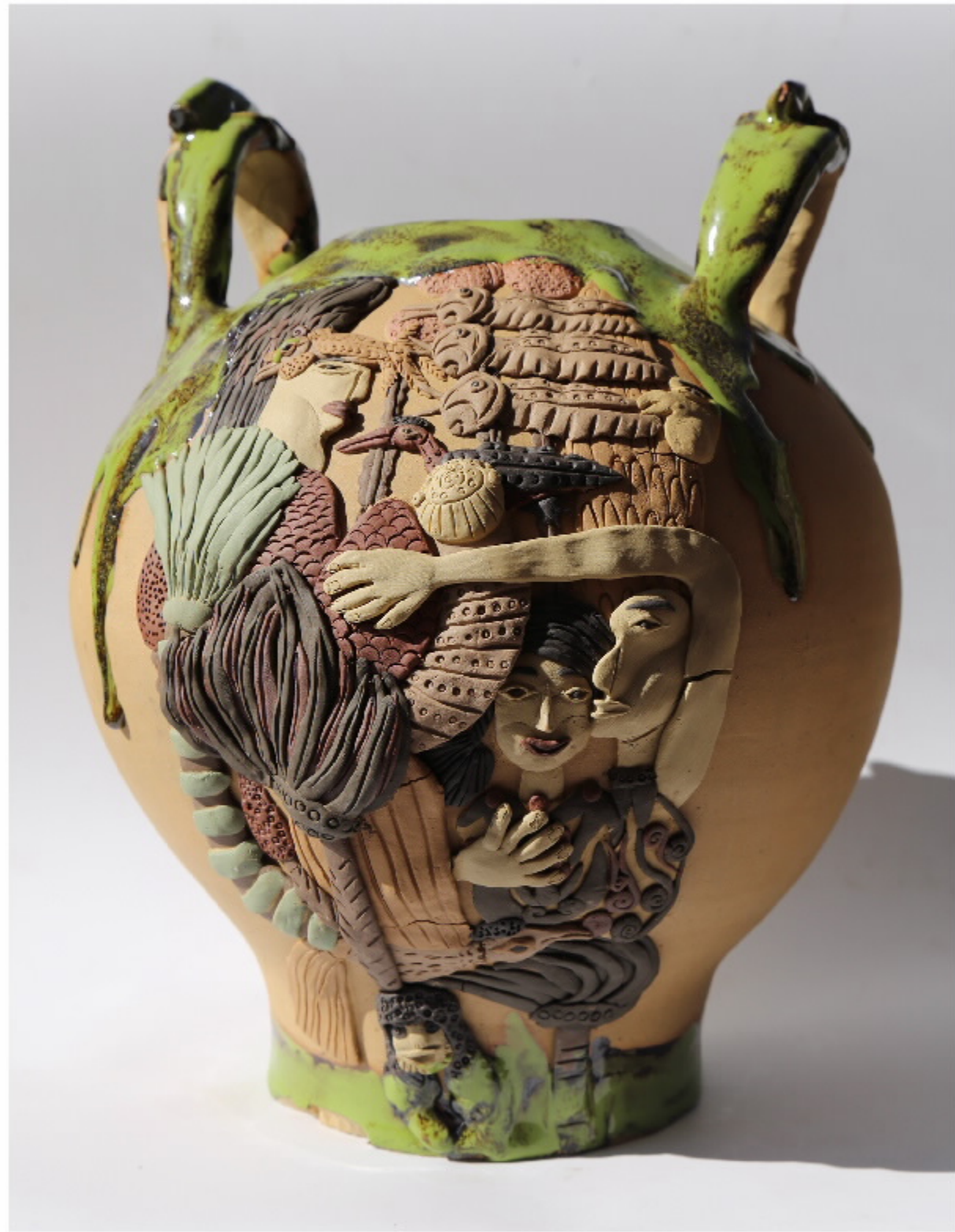
《典斯得地》号 尺寸: 28cm x 18cm x 25cm 作者: 张成东