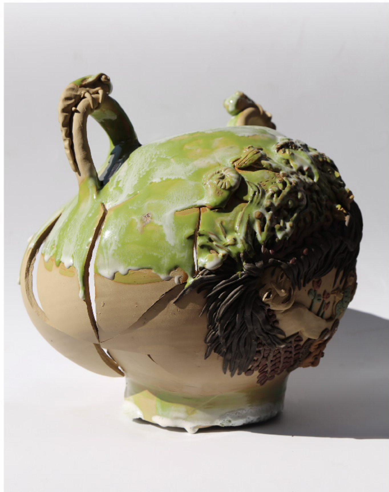
七火陶器1号 尺寸: 31cm x 30cm x 30cm 作者: 张汉东