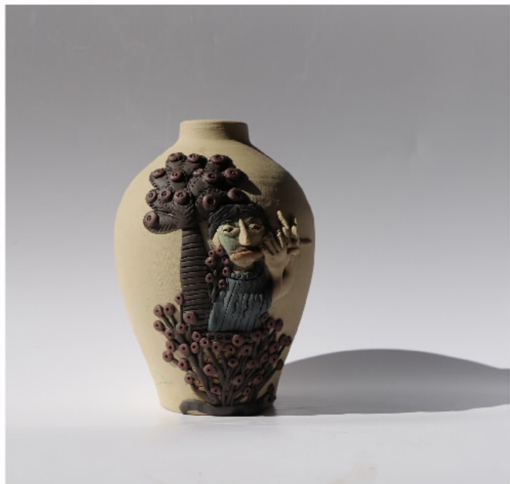
百山系列第78号 尺寸: 8.5cm x 3cm x 12.5cm 作者: 张汉东