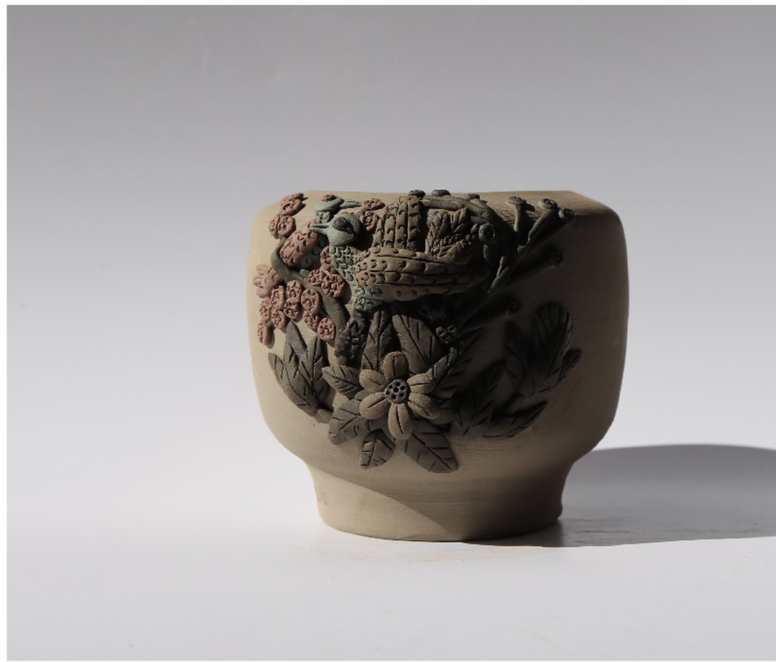
南来后得罐第1号 尺寸: 11cm x 6.5cm x 8cm 作者: 张汉东