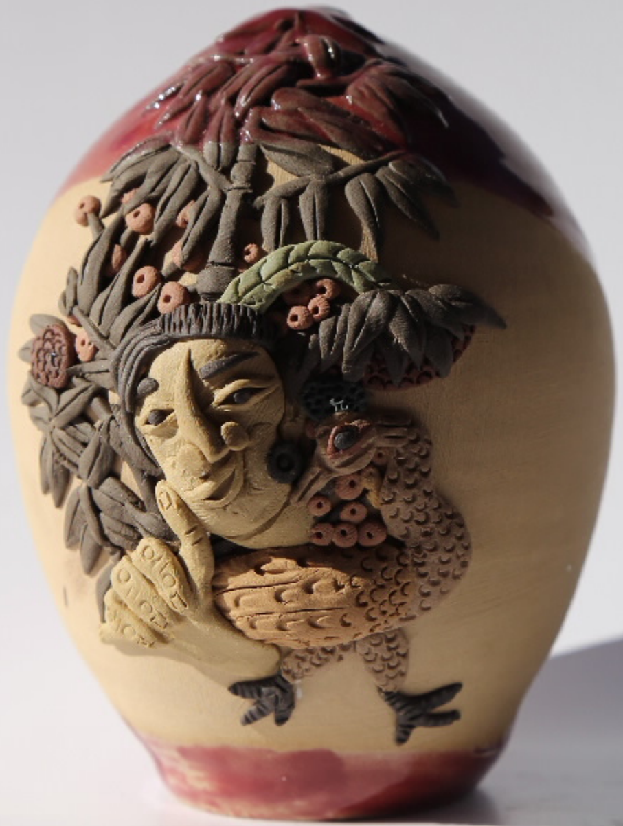
陶土雕刻的瓷瓶 尺寸: 9cm x 6.2cm x 11cm 作者: 张汉华