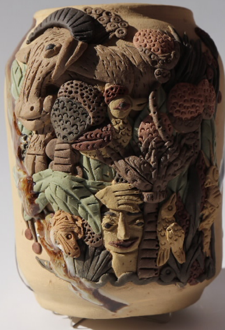
南风习海罐(部分) 尺寸: 16.0cm x 6cm x 20.0cm 作者: 张淑华