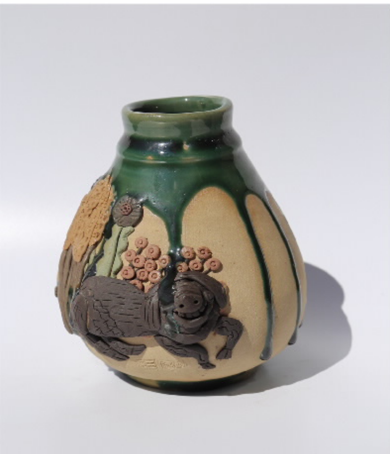
《渔翁的梦》100号 尺寸: 11cm x 4cm x 12cm 作者: 张汉东