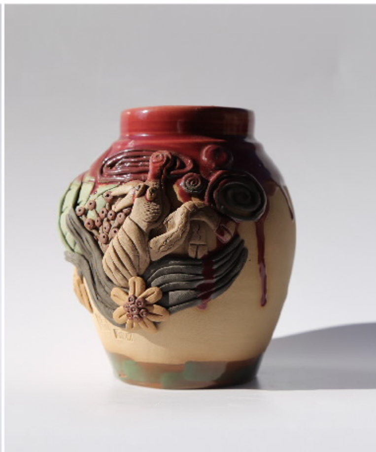
《渔翁的梦》101号 尺寸: 11cm x 4cm x 12cm 作者: 张汉东