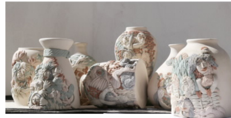
南虫艺术陶瓷作品

在过去三十多年几乎没有选择的以西方“面”造型主导的艺术体系学习和实践中，凭着对于本土文化和艺术的热爱，无意识的将丰富的地方文化元素、民族特色文化逐渐融入到艺术创作中。在之后的实践和探索中自然地应用了个性追求需要的解构、重组艺术思维和表现主义手法进行