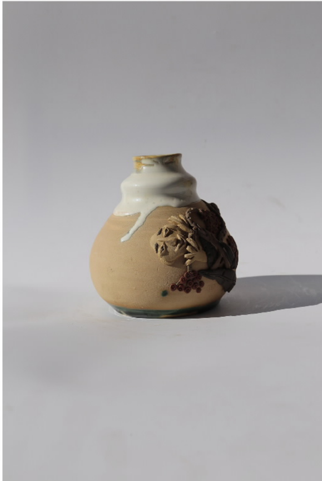
瓷质贴附雕塑号 尺寸: 11cm x 3cm x 12cm 作者: 张汉东