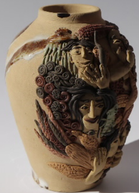
陶器雕塑系列 尺寸: 30cm x 16cm x 14.5cm 作者: 张强东