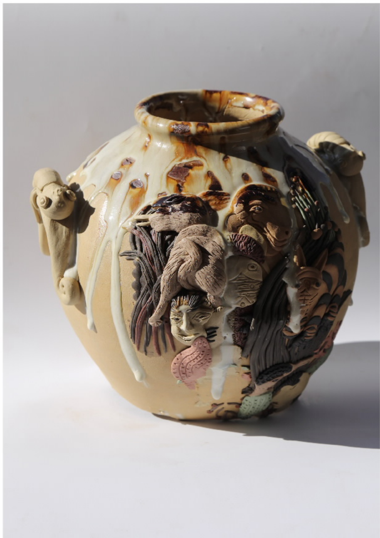
雪山陶器2号 尺寸: 27cm x 9.5cm x 30cm 作者: 张汉东