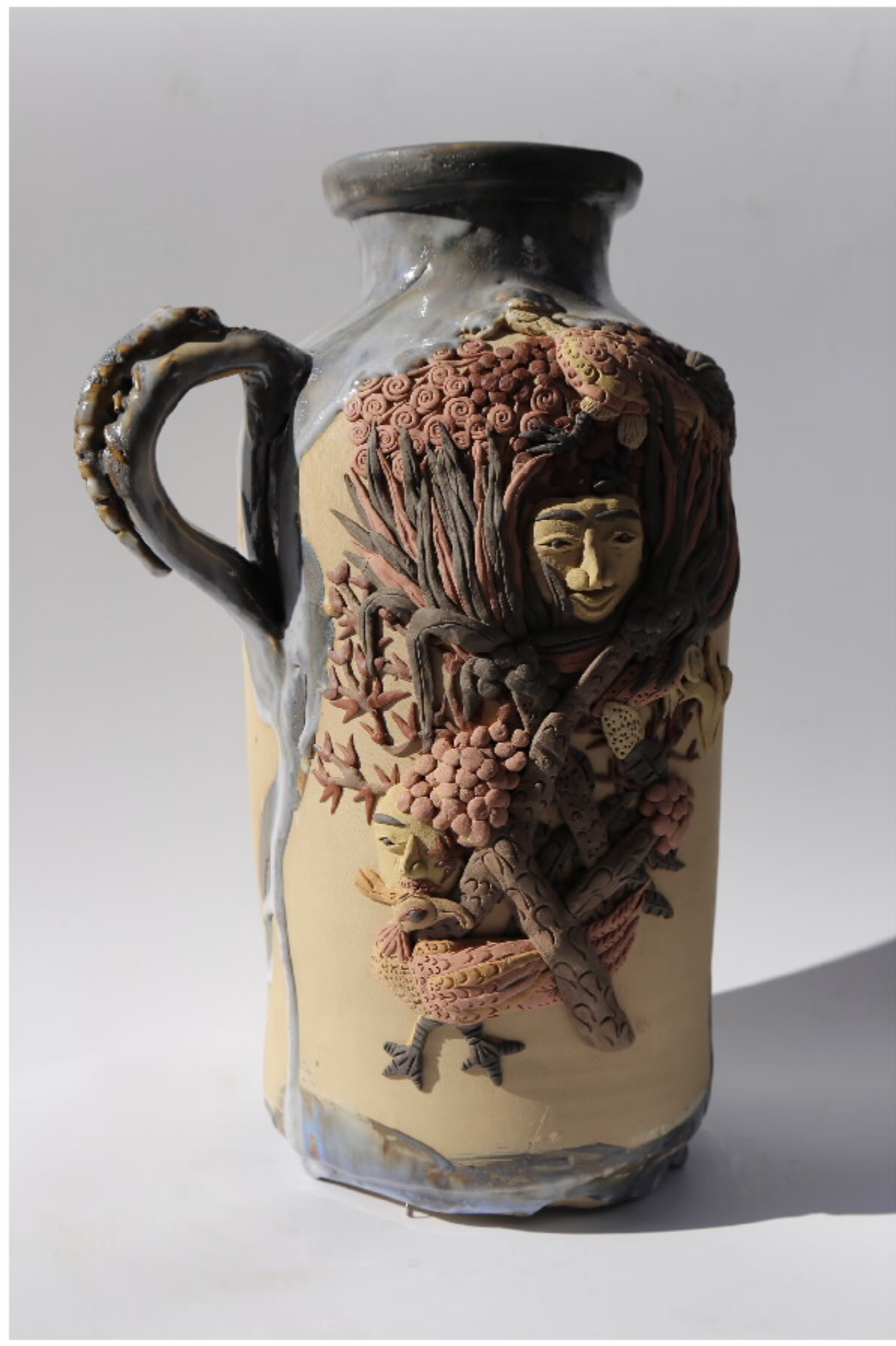
青山里陶器6号 尺寸: 19.5cm x 7.5cm x 31.5cm 作者: 张汉东