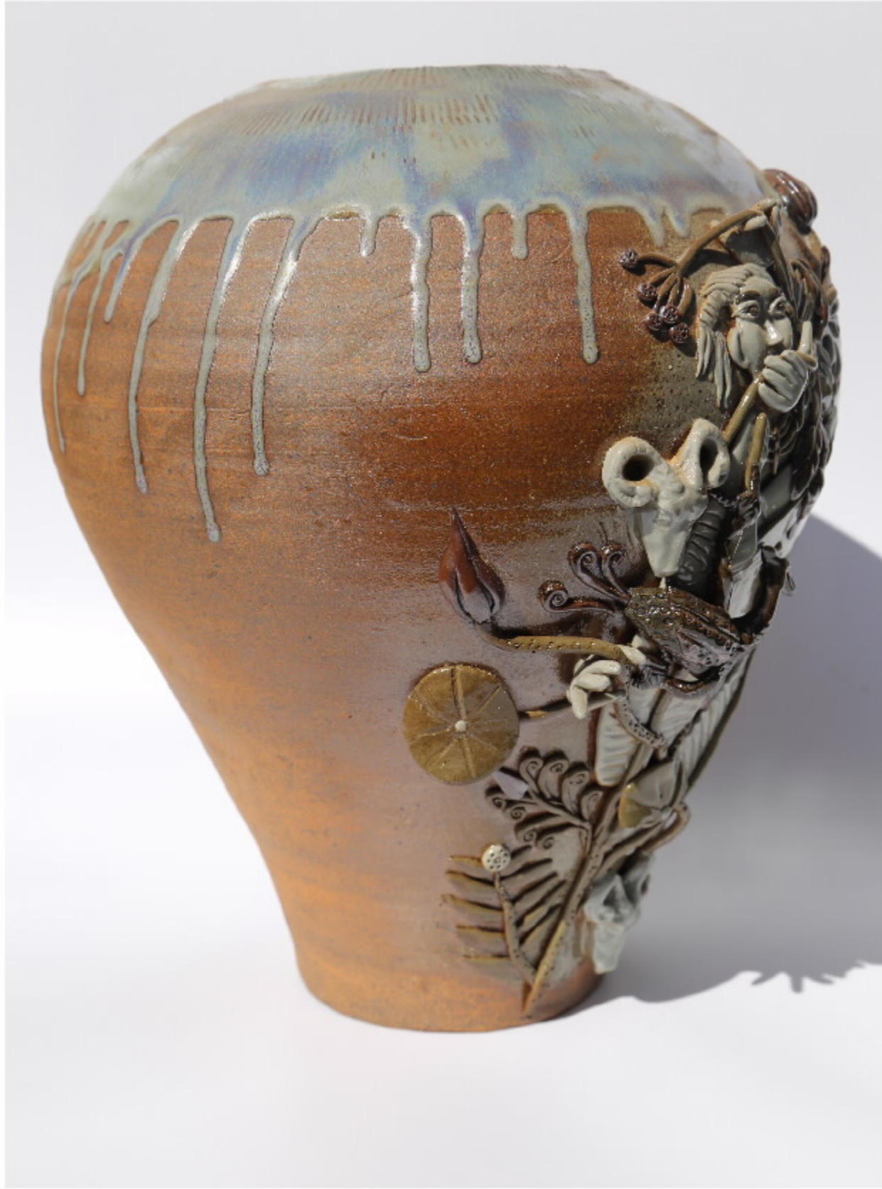
《龙腾虎跃》 尺寸: 25cm x 18cm x 15cm 作者: 张成志