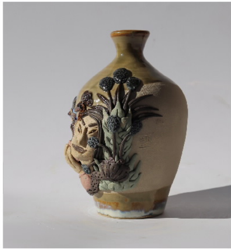
虎头瓶局部图 尺寸: 8cm x 5.5cm x 14cm 作者: 张汉家