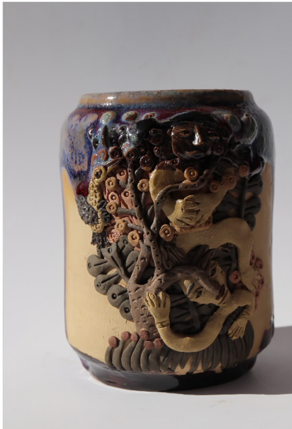
蓝色静观图 尺寸: 10.5cm x 10cm x 12cm 作者: 张汉永