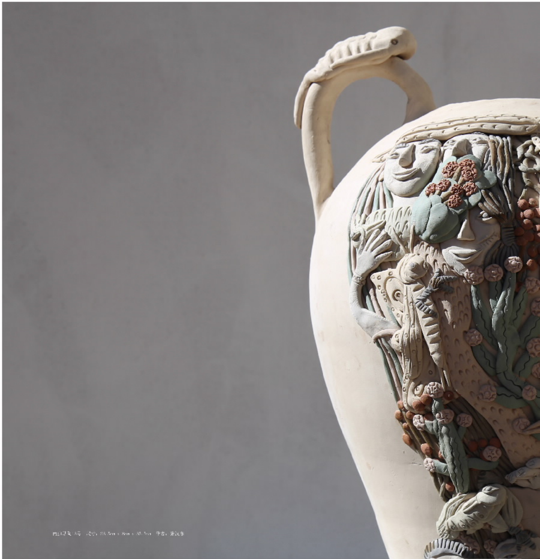
陶器及3号 尺寸: 28.5cm x 8cm x 35.5cm 作者: 井汉生