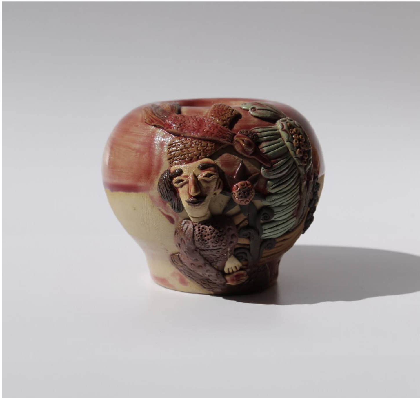
日月星辰瓷瓶 尺寸: 11cm x 8cm x 9cm 作者: 张汉东