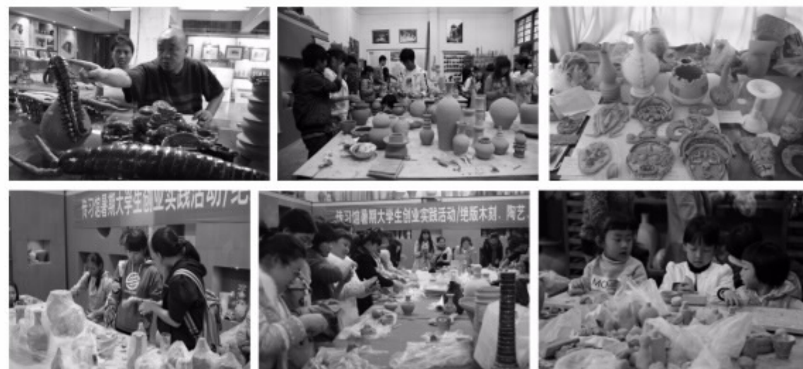
南虫艺术陶艺艺术创作、创意创新、参与体验、能力形成、美育实践

统工艺和现代创作理念基础上形成的独特艺术形式，在南虫艺术发展建设中具有着前所未有的开创性，因此必将对南虫艺术的不断发展产生极为深远的意义。南虫艺术陶艺发展过程中以强烈的浮雕感体现出来的壮美意义进一步演化为实体建设中必不可少的大型南虫艺术主题陶艺浮雕、圆雕等特殊艺术形式，从而真实的赋予了南虫艺术不可替代的标志性文化意义。