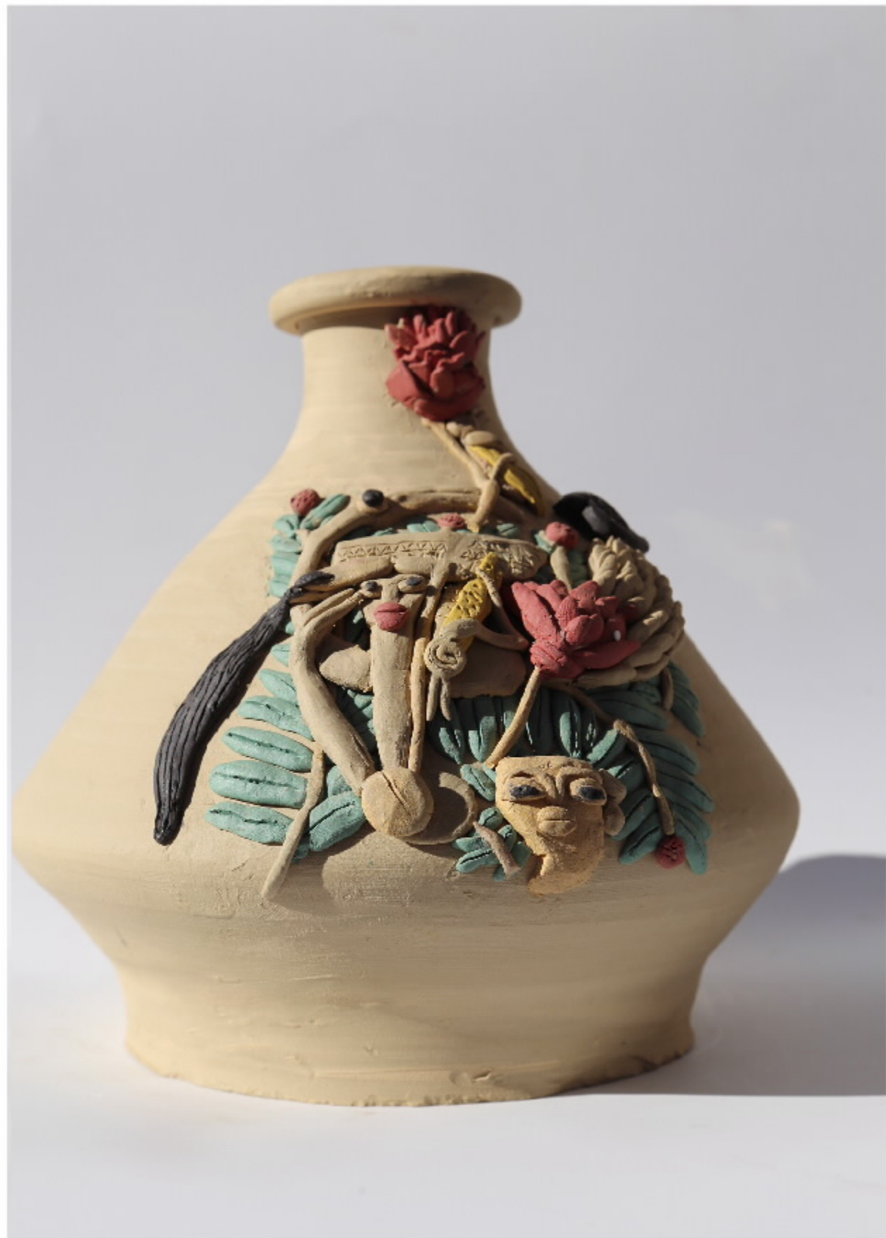
陶艺家陈国栋作品 尺寸: 20.5cm x 4cm x 19.5cm 作者: 陈国栋