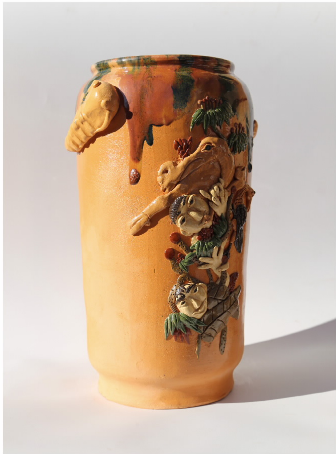
何山越陶器系列 尺寸: 21.5cm x 13cm x 32cm 作者: 施汉东