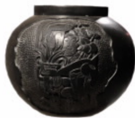
南虫艺术陶艺黑陶作品