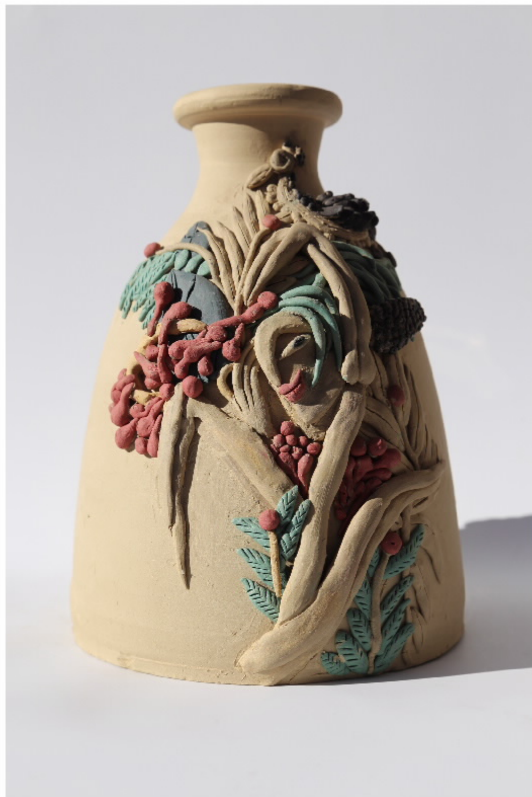
南风习海罐(部分) 尺寸: 16.0cm x 6cm x 20.0cm 作者: 张淑华