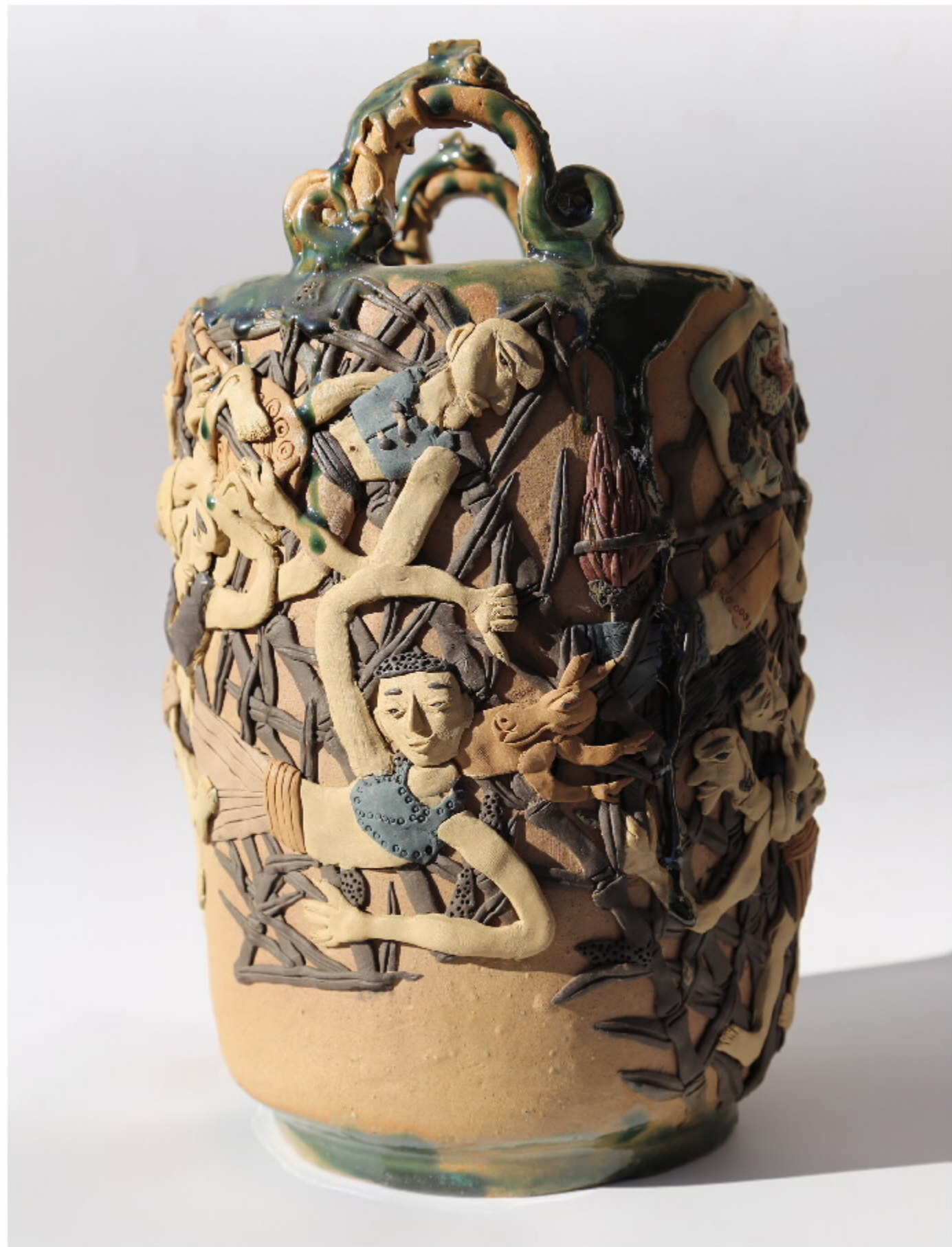
南岛站编钟1号 尺寸: 26cm x 26cm x 33cm 作者: 张汉东