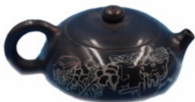
南虫艺术建水紫陶