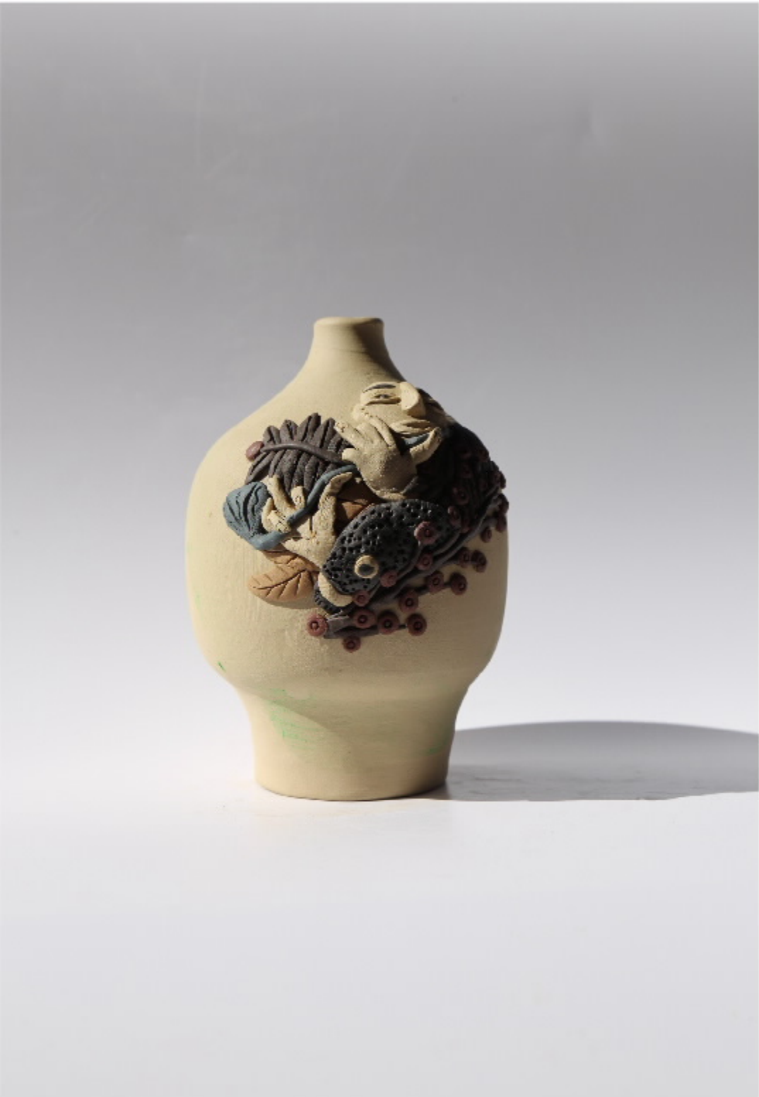
瓷质贴附雕塑号 尺寸: 9cm x 2cm x 12.5cm 作者: 张汉东