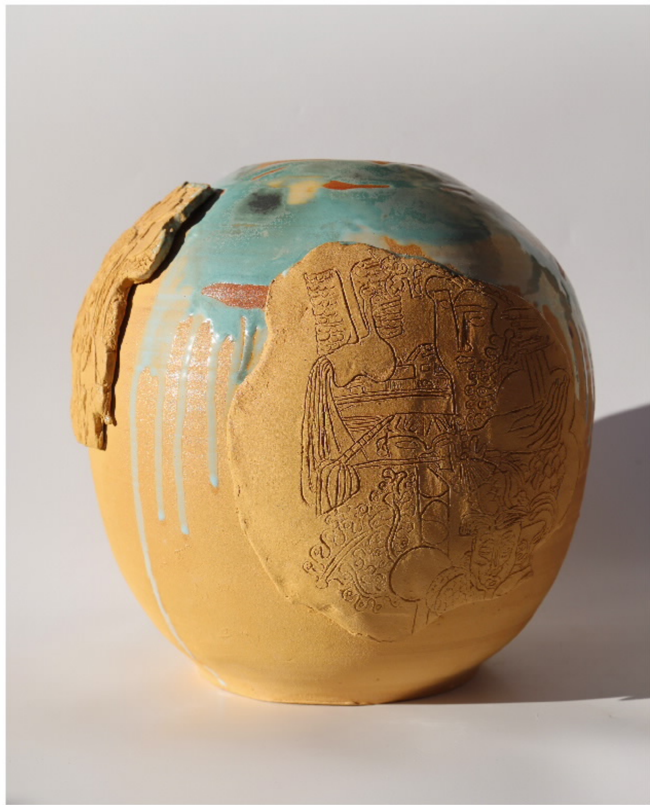
《典斯得地》号 尺寸: 28cm x 18cm x 25cm 作者: 张成东