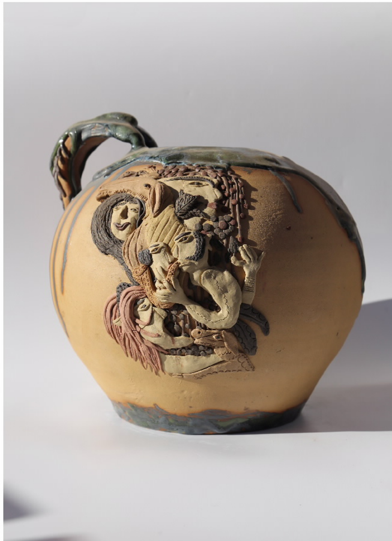
《秋乐图》陶器号 尺寸: 29.5cm x 33.5cm x 28.5cm 作者: 张敬东