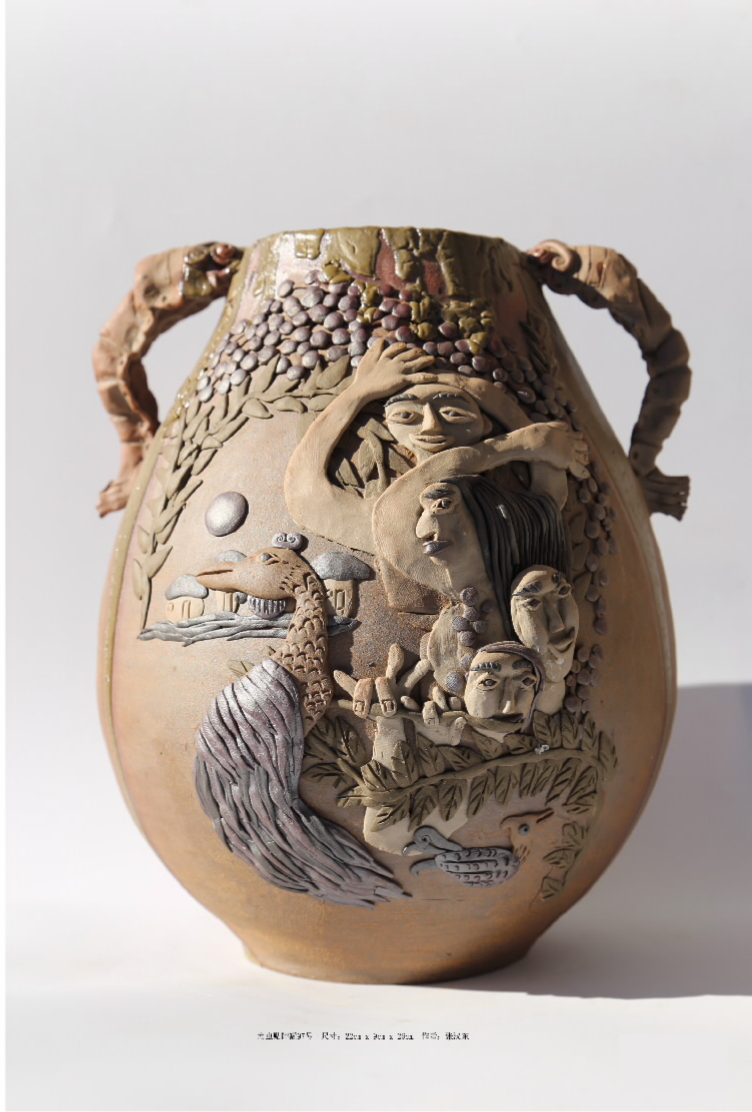
光山果的陶器号 尺寸: 22cm x 36cm x 26cm 作者: 张欣春