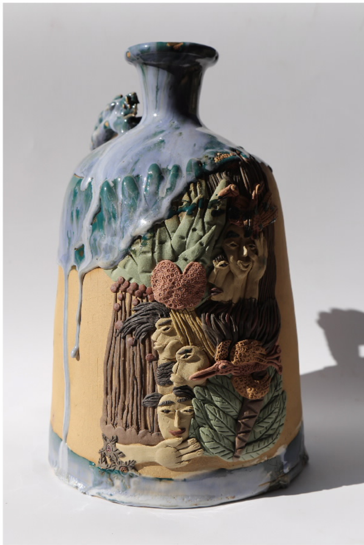
青山里陶器5号 尺寸: 20.5cm x 4.5cm x 31.5cm 作者: 张汉东