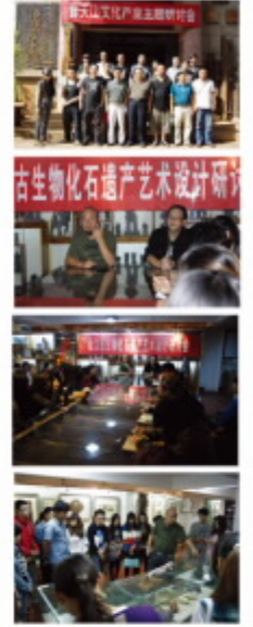
南虫陶瓷艺术·澄江化石艺术创新活动