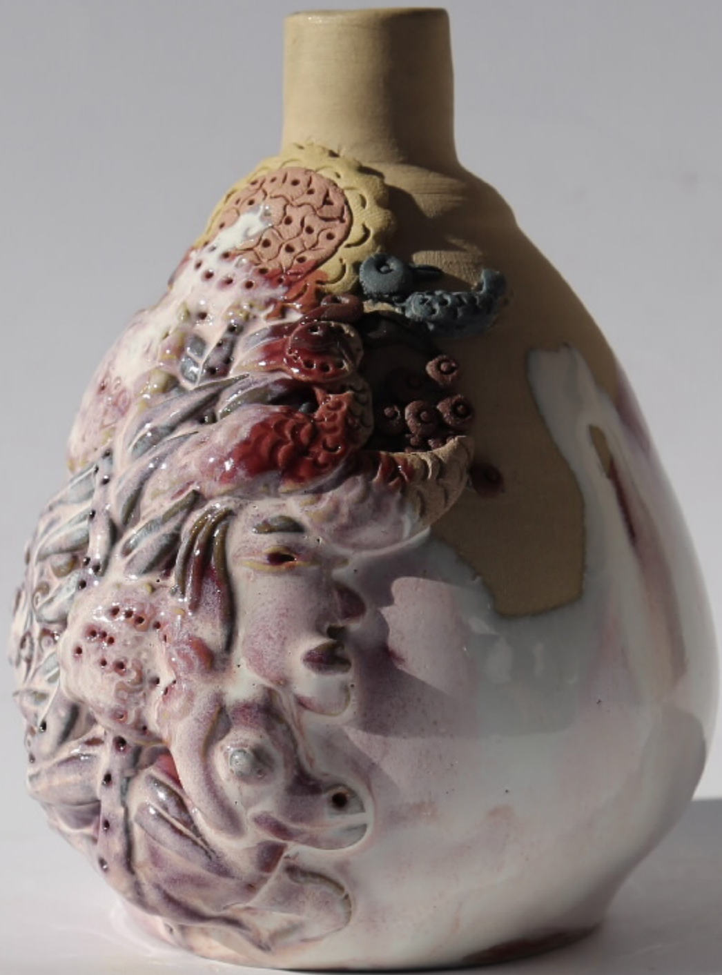
七水集图(局部)号 尺寸: 10.5cm x 5cm x 13.5cm 作者: 张汉东