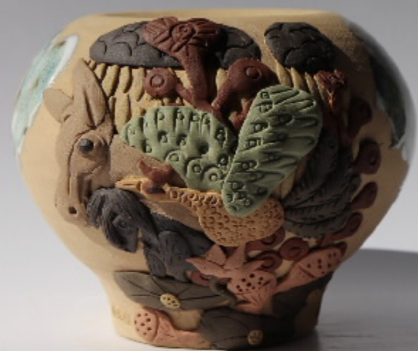
陶器雕塑系列 尺寸: 18cm x 16cm x 14cm 作者: 张强东