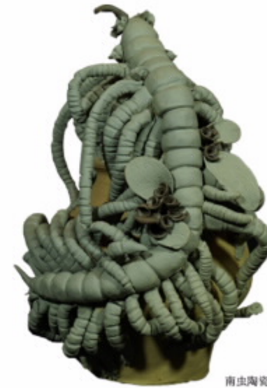
南虫陶瓷艺术·澄江化石艺术陶