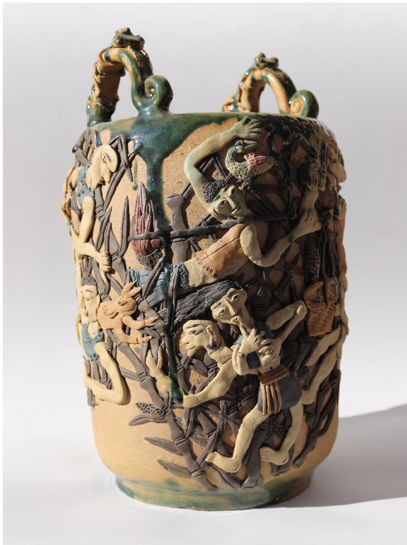
南岛站编钟1号 尺寸: 26cm x 26cm x 33cm 作者: 张汉东