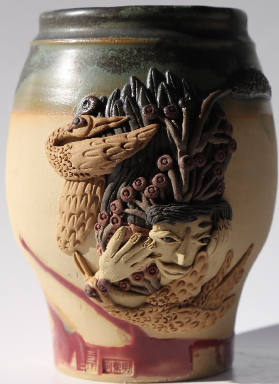
加山青陶罐11号 尺寸: 10.5cm x 6.5cm x 13cm 作者: 张俊东