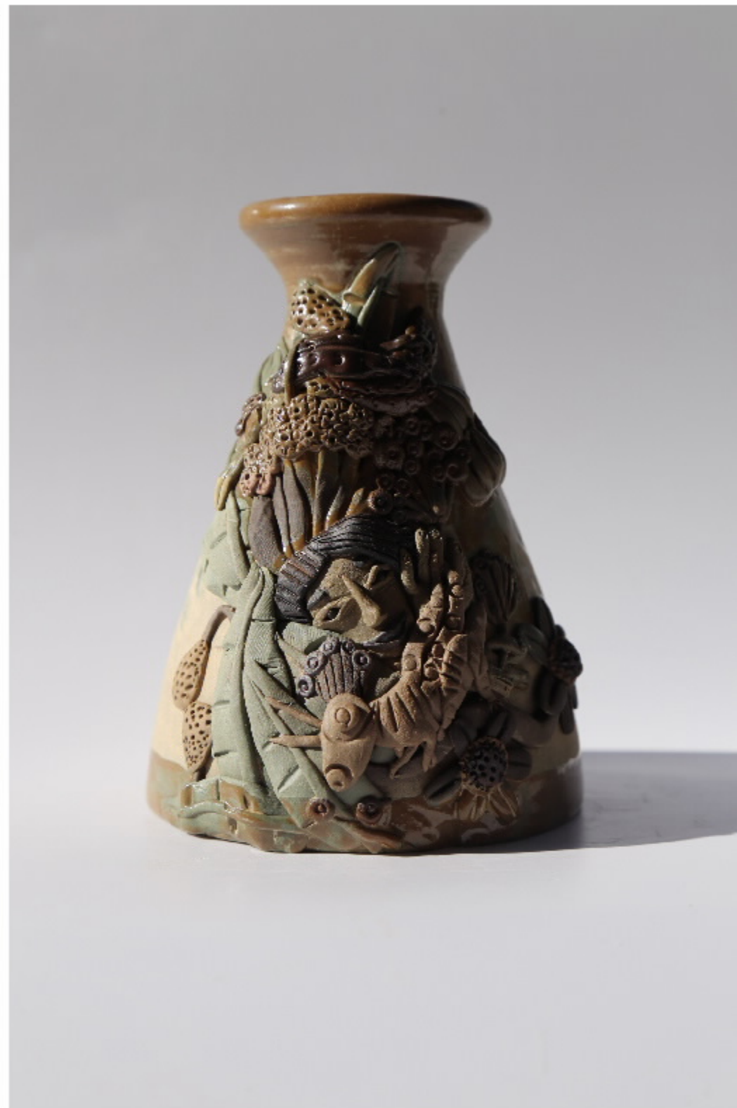
陶瓷器编号: 尺寸: 5cm x 5cm x 17cm 作者: 张汉东