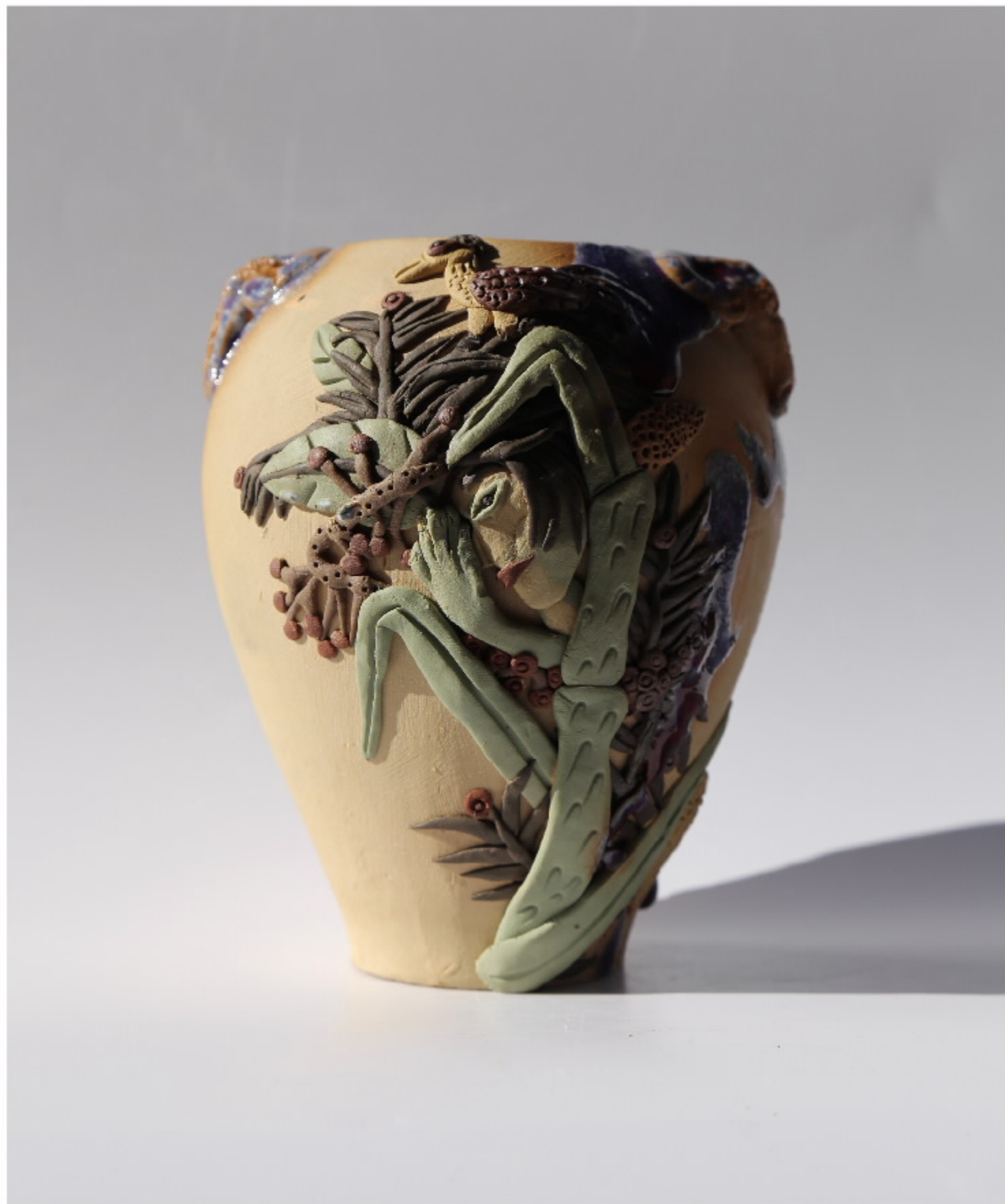
青白瓷花瓶3号 尺寸: 11cm x 5cm x 18cm 作者: 张汉东