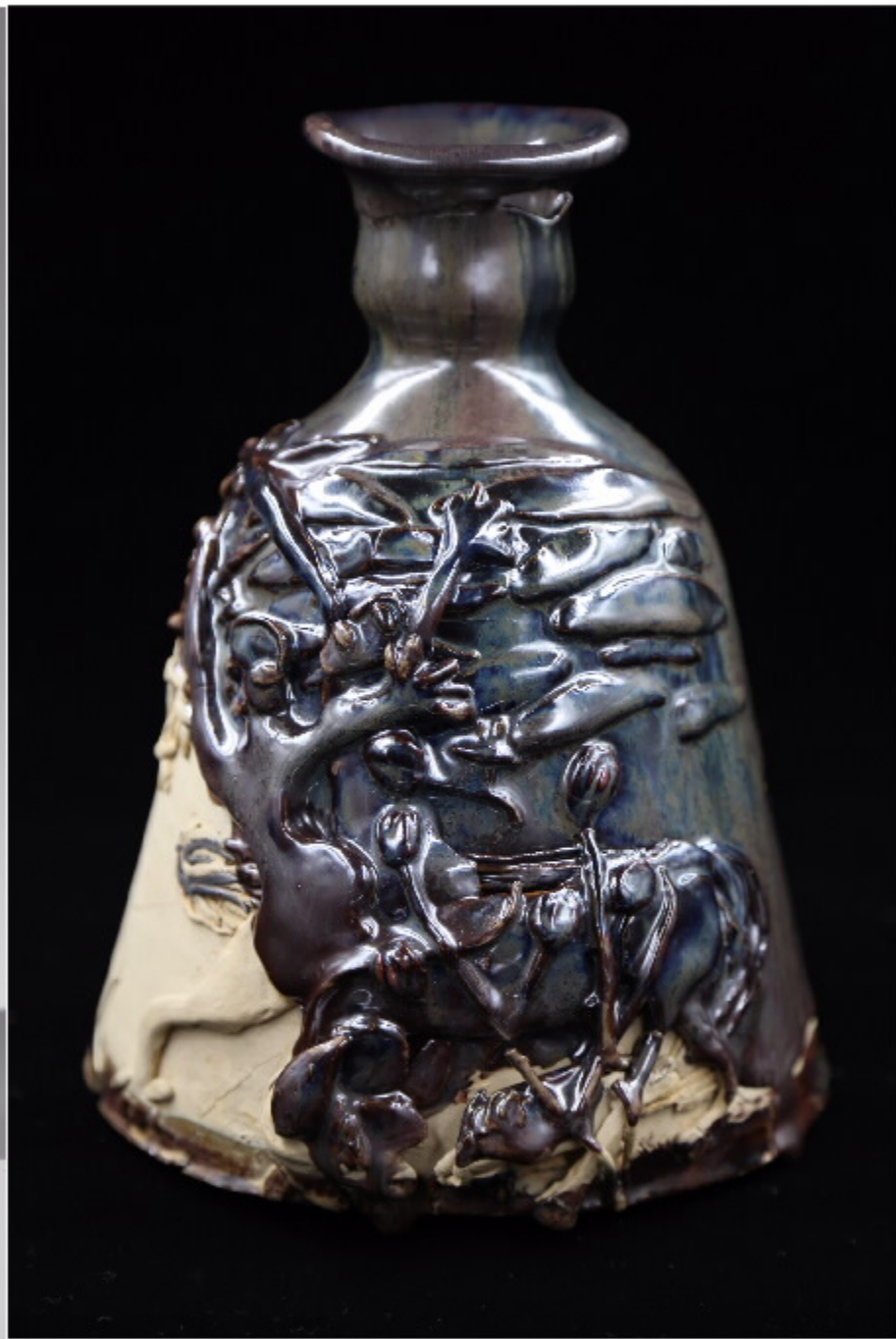
南美洲的陶器 尺寸: 11cm x 5.5cm x 23.5cm 作者: 张汉东