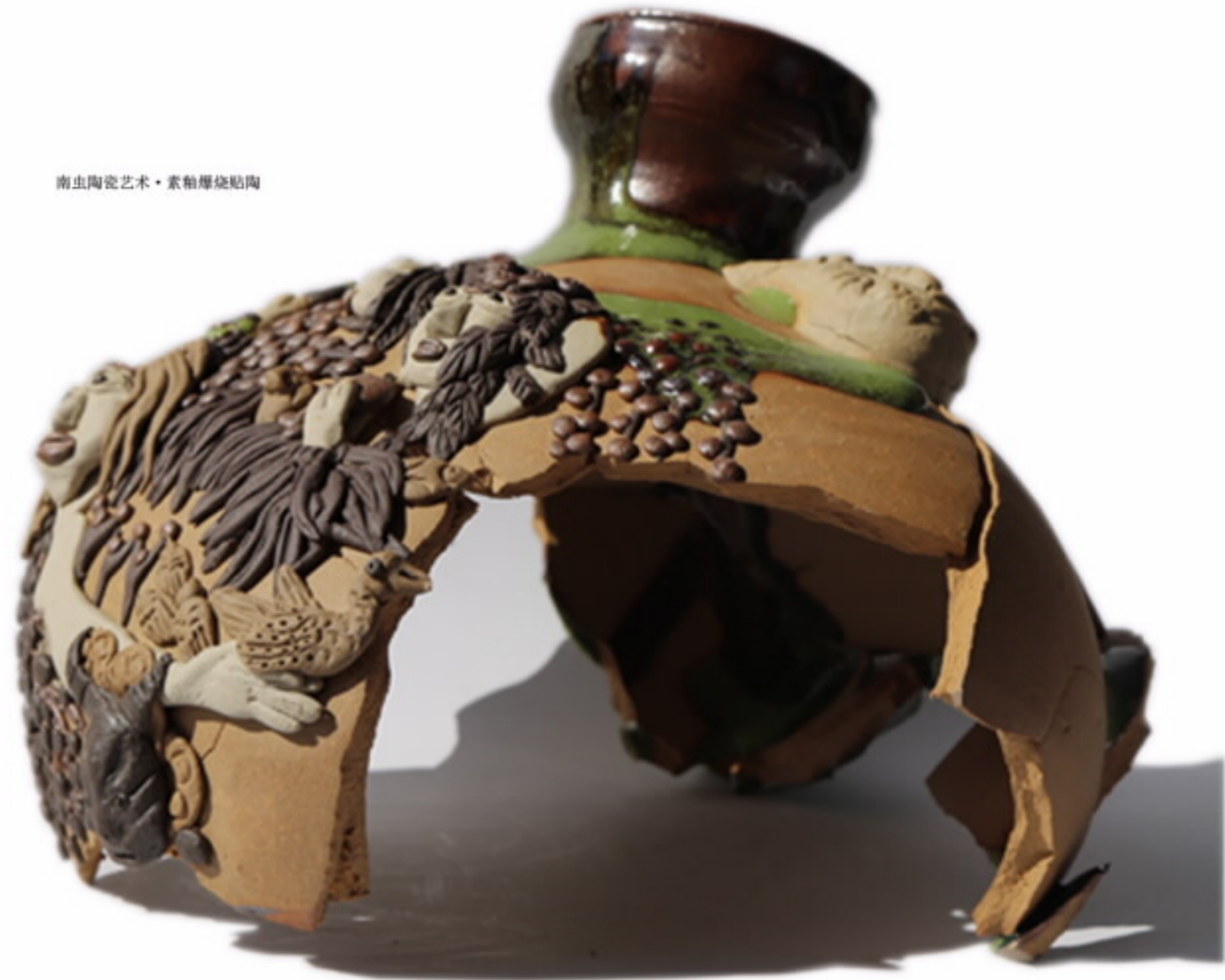
南虫陶瓷艺术·素釉厚烧陶