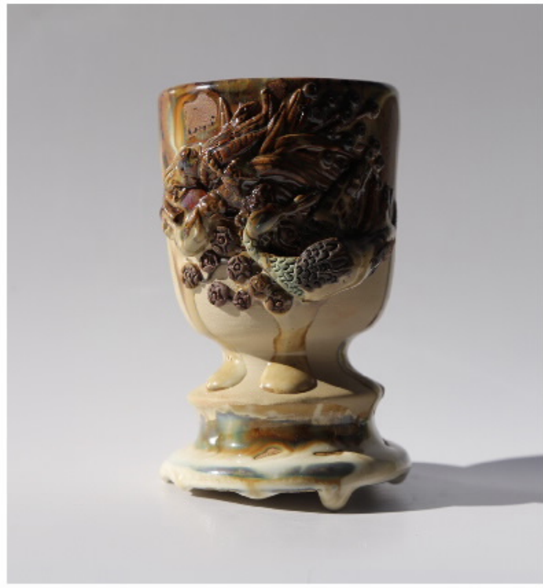
虎头瓶局部图 尺寸: 8cm x 6.5cm x 14cm 作者: 张汉家