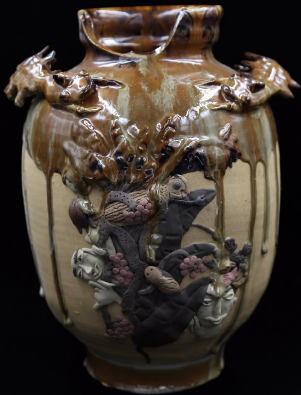
图1 静观鹿兔图 尺寸: 34cm x 19cm x 34cm 作者: 张汉东