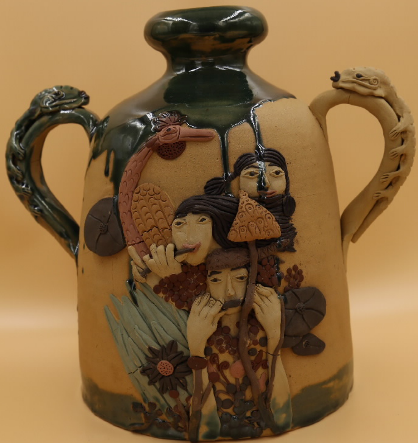
白浪潭茶壶(局部) 尺寸: 30cm x 6cm x 21.5cm 作者: 张汉东