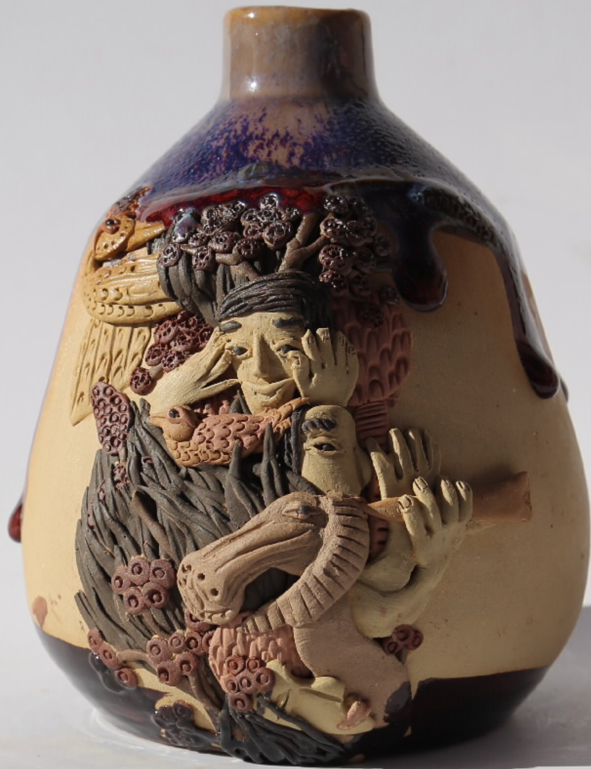
双鹿牌陶器编号 尺寸: 19cm x 20cm x 11.5cm 作者: 张汉东