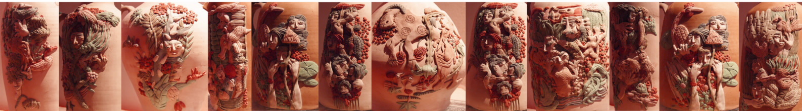
南虫艺术陶艺浮雕效果贴陶作品 作者：张汉东 2015年

而产生的南虫艺术大型陶艺浮雕中更加凸出的显示出陶瓷艺术对南虫艺术主题建设的神奇意义。