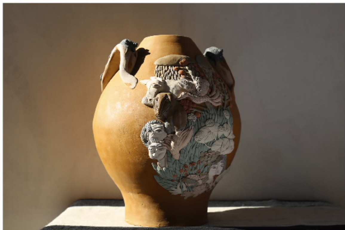
《农耕神像》 尺寸: 28.5cm x 17.5cm x 30.5cm 作者: 张汉东