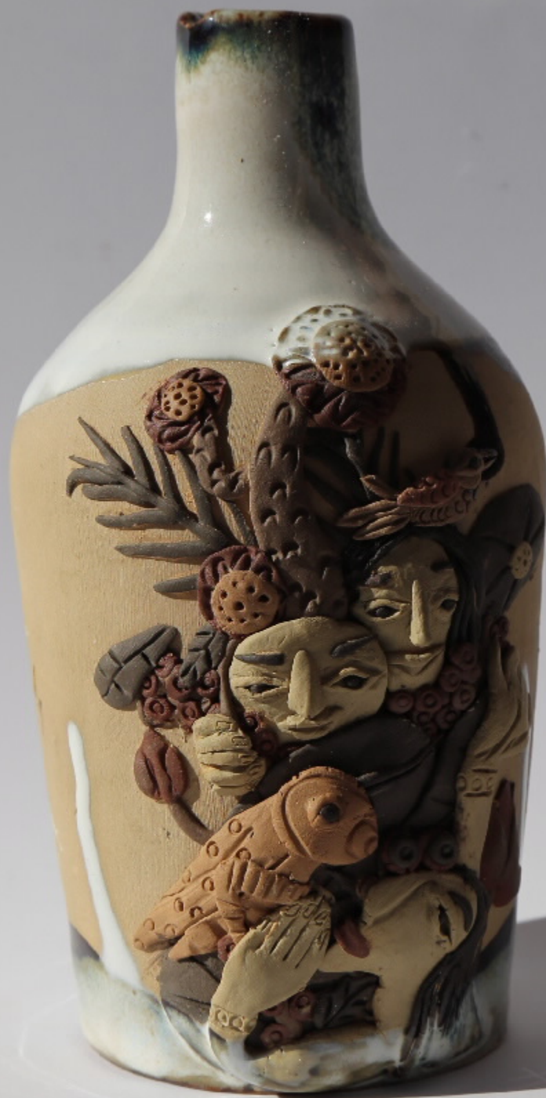
百山系列第80号 尺寸: 9.5cm x 2cm x 13.5cm 作者: 张汉东