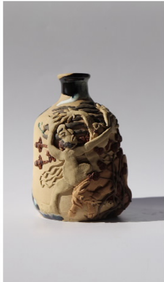
双鹿牌陶器编号 尺寸: 3cm x 3cm x 1.5cm 作者: 张汉东