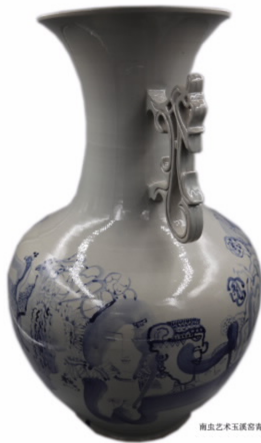
南虫艺术玉溪窑青花