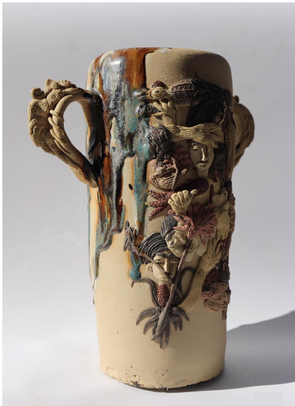
雪山陶器26号 尺寸: 27.5cm x 7.5cm x 25cm 作者: 张汉东