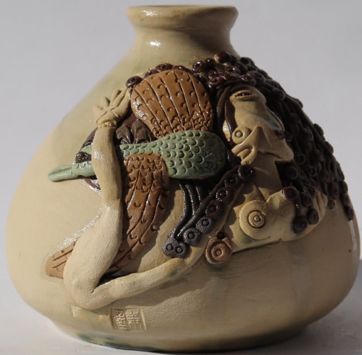
青山观竹图105号 尺寸: 10.5cm x 8cm x 10.5cm 作者: 张汉东