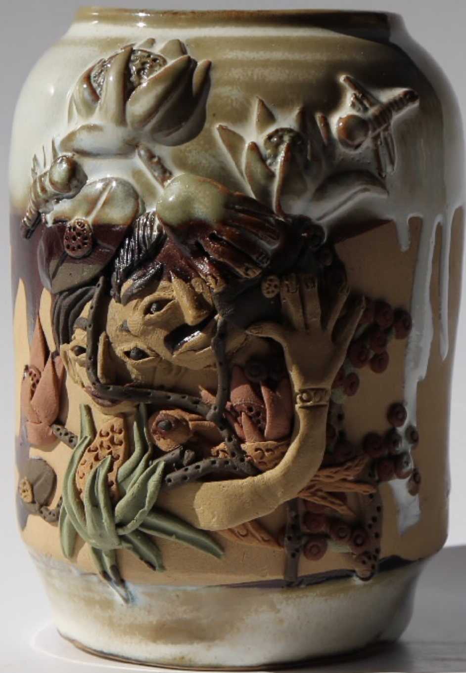
高克勤的罐(2) 尺寸: 8cm x 8cm x 12cm 作者: 高克勤