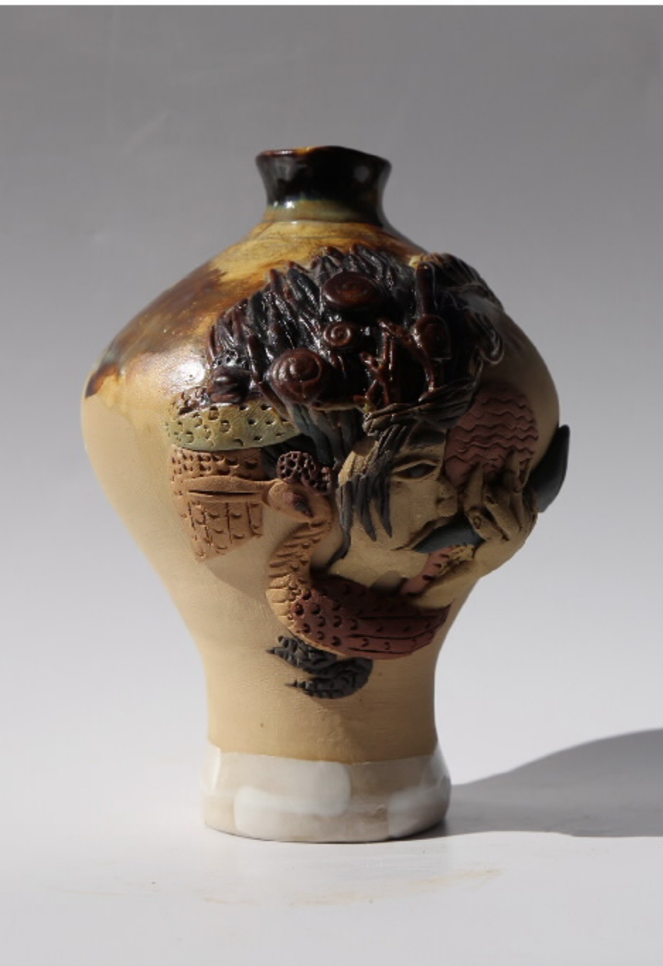
南美洲的陶器 尺寸: 9.5cm x 4.5cm x 13cm 作者: 张汉东