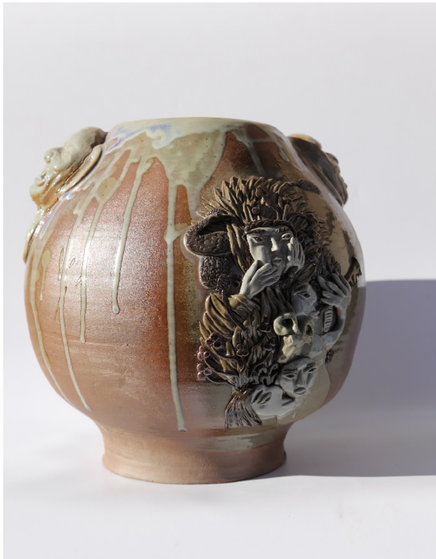
七虫鬼脸陶器 尺寸: 27.5cm x 9.5cm x 27cm 作者: 张欣东