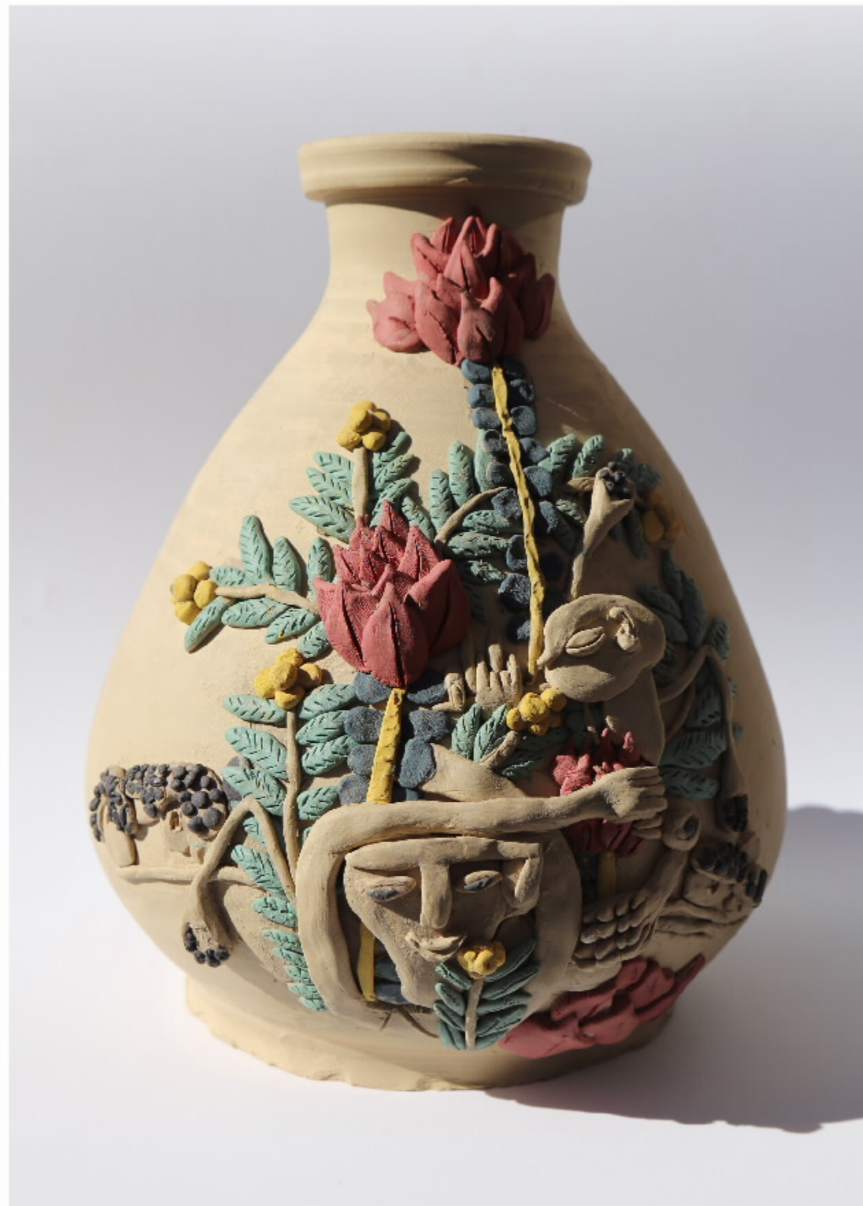
陶艺家陈国栋作品 尺寸: 15cm x 4cm x 18cm 作者: 陈国栋