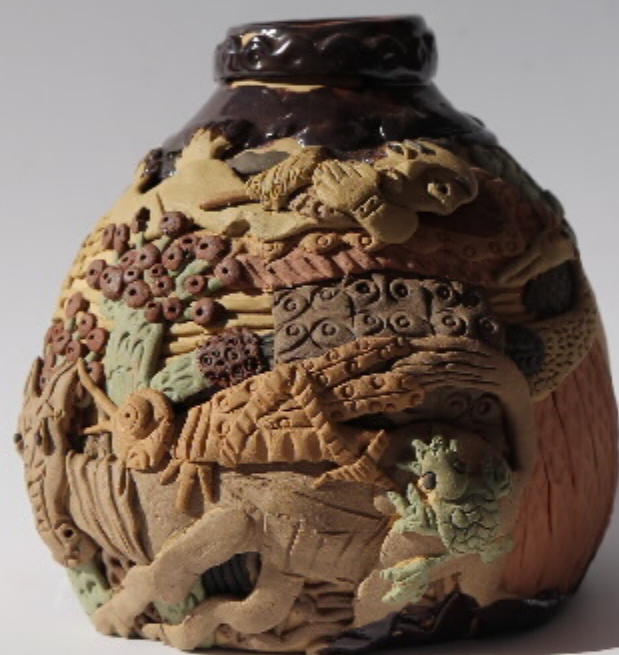
陶器雕塑系列 尺寸: 20cm x 20cm x 12.5cm 作者: 张强东