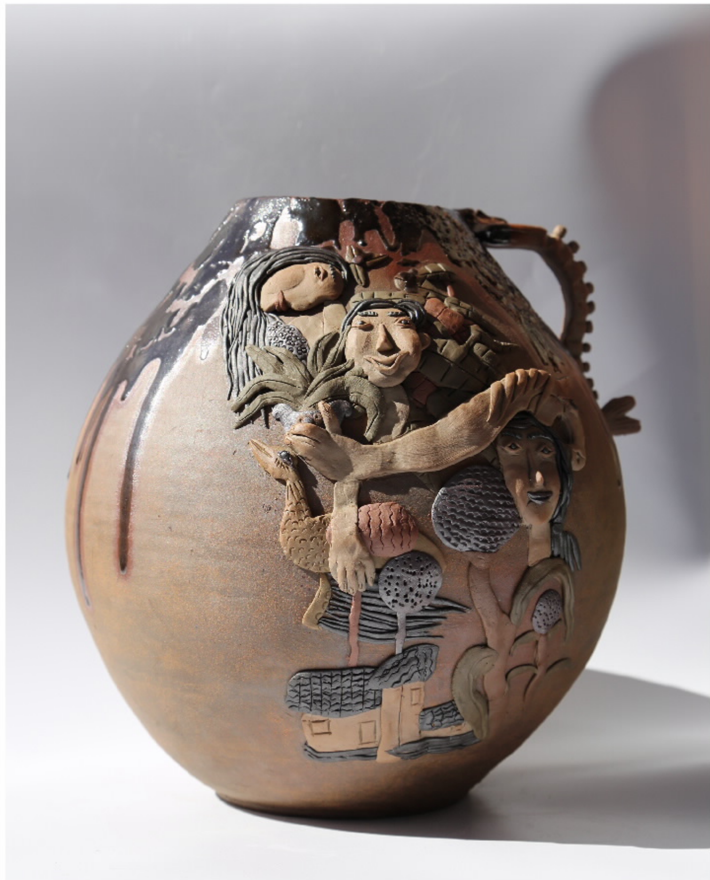
荷风陶器 尺寸: 29cm x 16cm x 26cm 作者: 张欣东