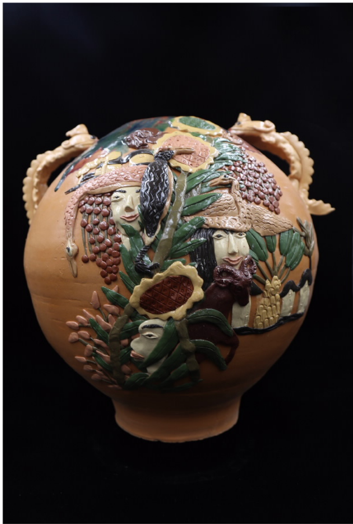
美索不达米亚陶器 尺寸: 31cm x 18cm x 32.5cm 作者: 张汉东