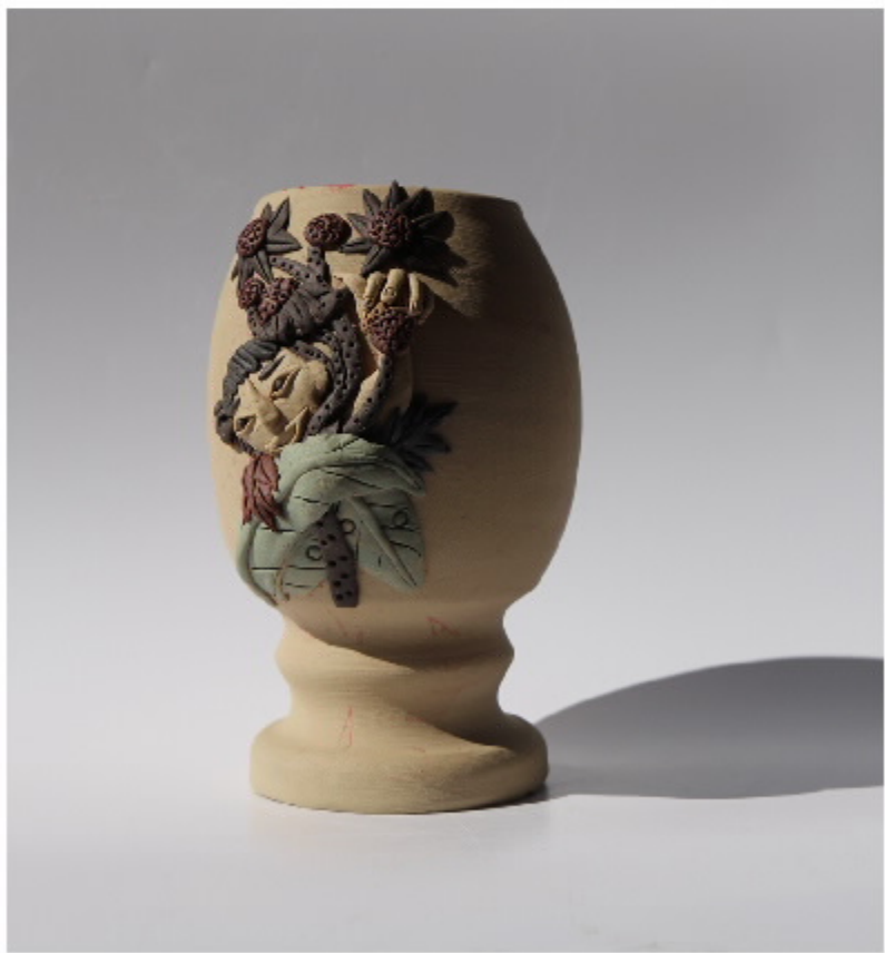
虎头瓶局部图 尺寸: 8.5cm x 11.5cm x 13cm 作者: 张汉家