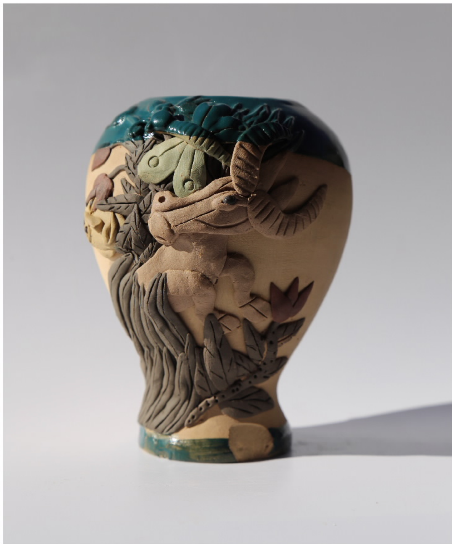
青白瓷花瓶4号 尺寸: 10.5cm x 4.5cm x 18.5cm 作者: 张汉东