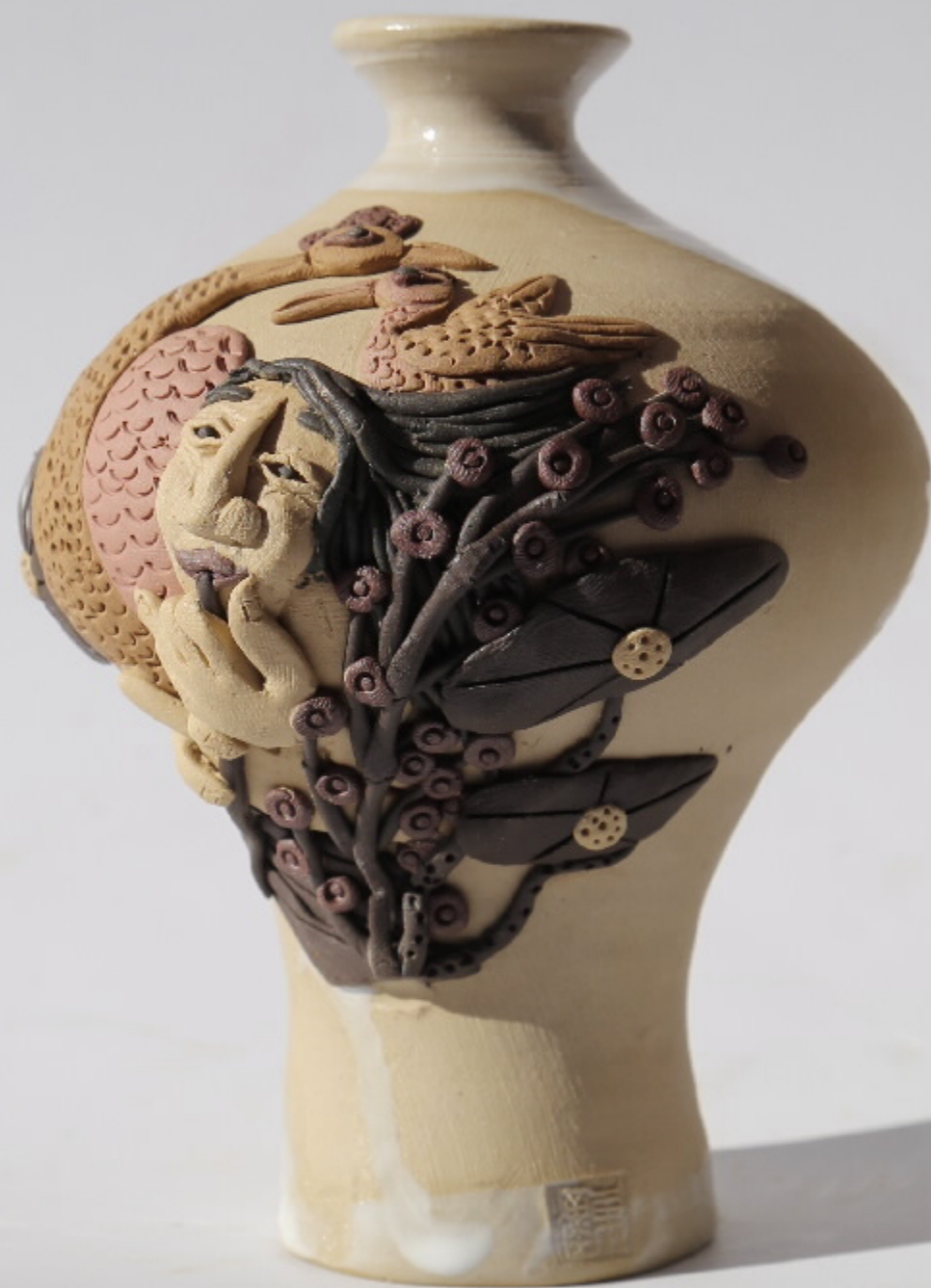
青山观竹图105 尺寸: 10cm x 8cm x 13.5cm 作者: 张汉东