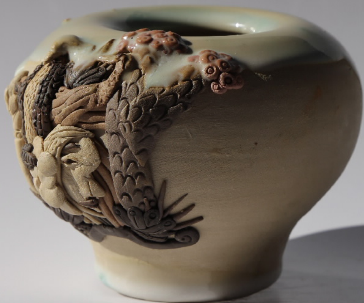
青白瓷刻花龙纹杯 尺寸：10cm x 4.5cm x 9cm 作者：张悦东