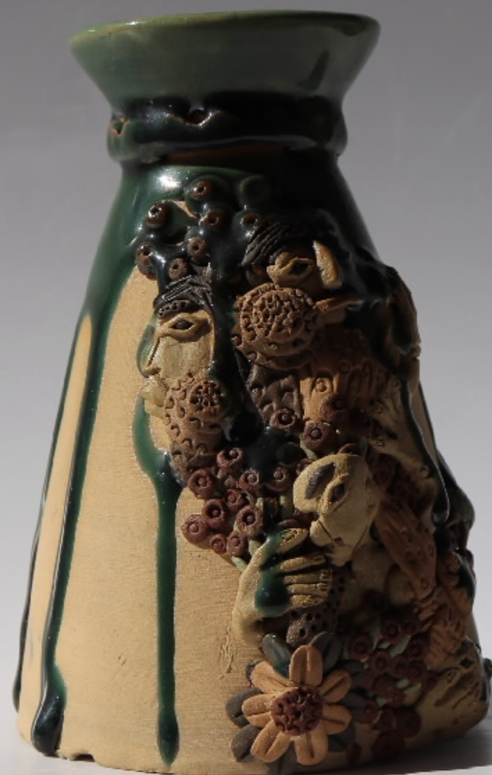
南方的海味, 陶器, 尺寸: 31.0cm x 30cm x 13cm, 作者: 张强东