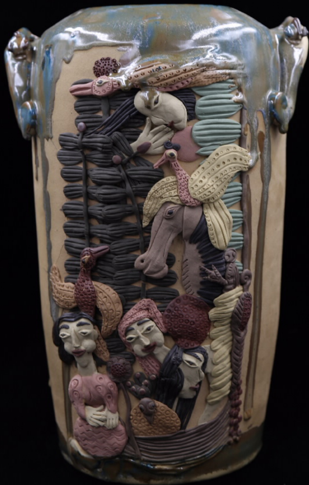
民间艺术系列 | 尺寸: 20cm x 10cm x 6cm | 作者: 陈国栋