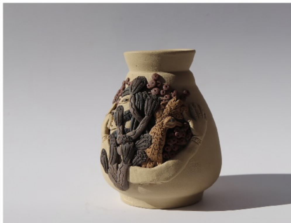
百山系列第79号 尺寸: 6.5cm x 5.5cm x 9cm 作者: 张汉东