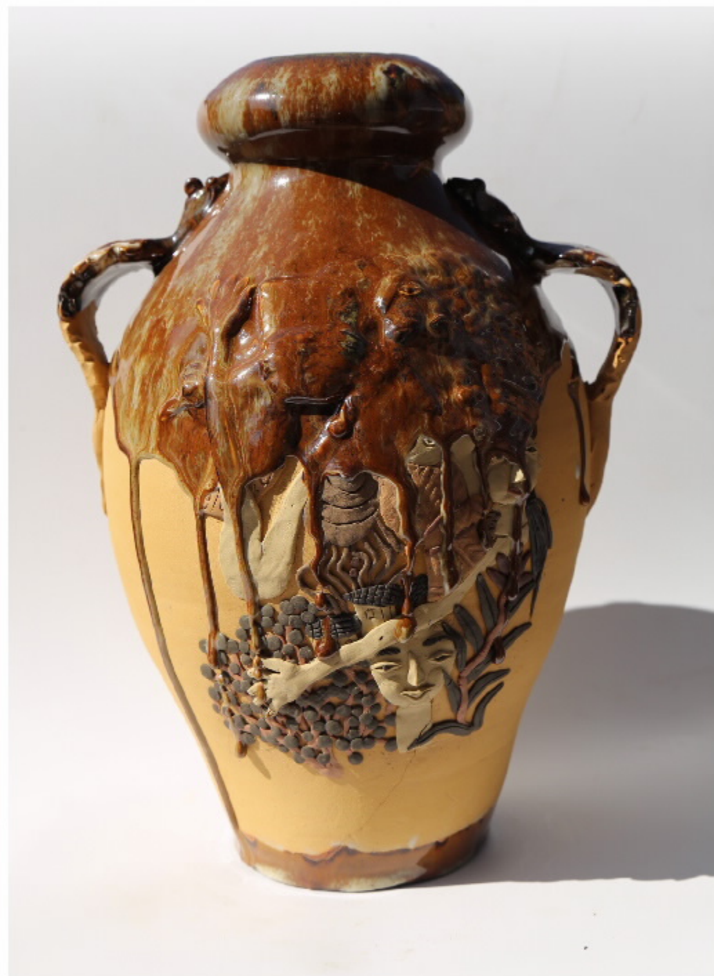
西昌黑陶第29号 尺寸: 23.5cm x 9cm x 33.5cm 作者: 张汉东