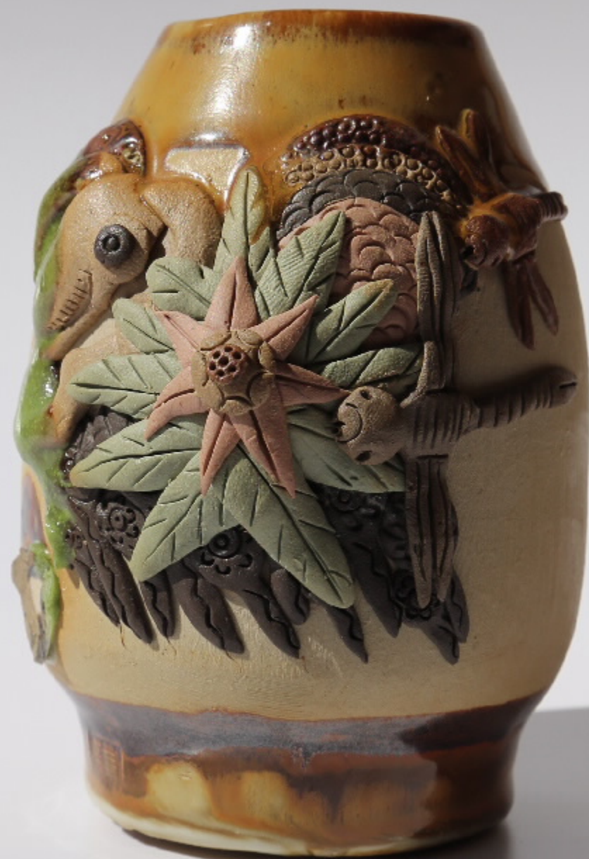
加山青陶罐12号 尺寸: 10cm x 4cm x 13cm 作者: 张俊东