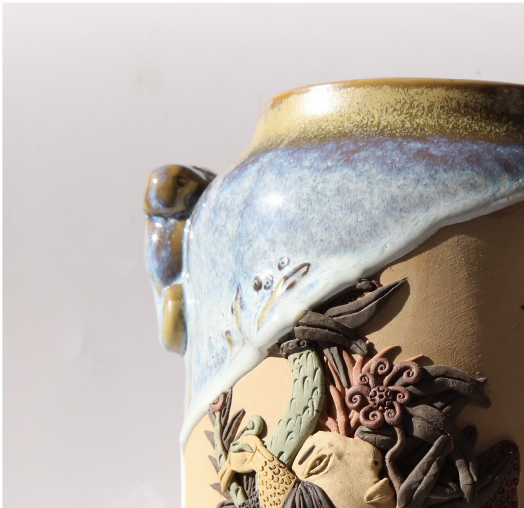
菊虫结陶罐16号 尺寸: 16cm x 10cm x 33cm 作者: 袁晓棠