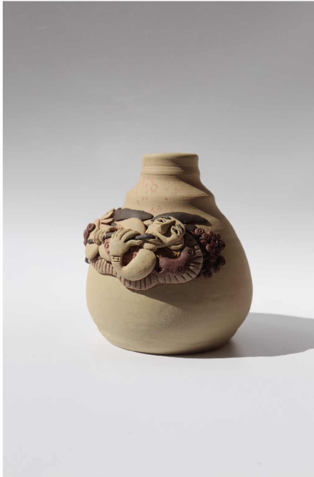
瓷质贴附雕塑号 尺寸: 11cm x 3cm x 12cm 作者: 张汉东